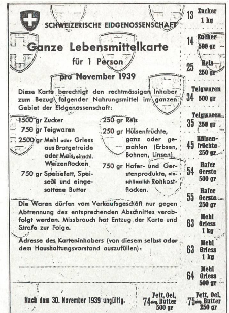
So sah die erste Lebensmittelkarte vom November 1939 aus: