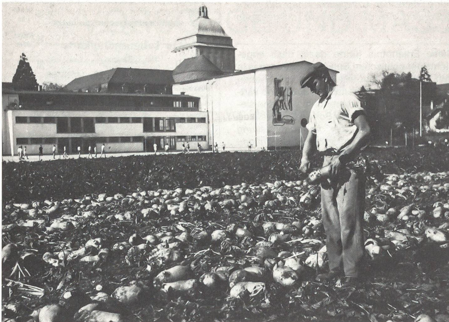
«Anbauschlacht» auf dem bewirtschafteten Sportplatz