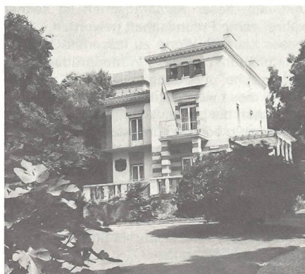
Krügers Haus in Clarens bei Montreux.

1883 wurde Krüger mit einer Mehrheit von \frac{3}{4} der Stimmen vor seinem Konkurrenten Joubert zum Staatspräsidenten gewählt. Dieses Amt hielt er inne bis zum Untergang der Südafrikanischen Republik im Jahre 1902. Er wurde in den Jahren 1888, 1893 und 1898 in seinem Amte bestätigt. Auch als oberster Repräsentant des Staates wollte er Gottes Wort als Richtschnur der Politik und als Fundament des Staates halten. Die übrigen Punkte seines «Regierungsprogramms» waren meistens auf die Bibel bezogen. Er gelobte Aufrechterhaltung der Regierungsautorität gegenüber den Eingeborenen sowie freundliche Behandlung gehorsamer Eingeborenenstämme auf den ihnen zugewiesenen Gebieten. 1886 wurde die Südafrikanische Republik von neuem ins Zentrum des internationalen Interesses gerückt. Der Grund dafür war die Entdeckung der Goldvorkommen im Witwaters-