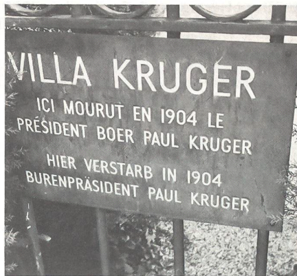
Gedenktafel am Gartentor (seewärts) von Krügers Haus in Clarens.

rand (im Süden des Landes). Dadurch wurde der Staat in seinen Grundfesten erschüttert, der Agrarstaat wurde zum Tummelplatz von Goldgräbern, Abenteurern und Spekulanten. Die meisten Zuzüger, die bald die Zahl der Buren übertrafen, waren englische Bürger. Die Buren befürchteten jetzt, im eigenen Staate an die Wand gedrängt zu werden, und sie ersannen eine Reihe von Massnahmen, um die «Uitlander», wie sie die Zuzüger nannten, unter Kontrolle zu halten. So stellten sie das für den Bergbau notwendige Dynamit unter Staatsmonopol. Die «Uitlander» hatten zudem hohe Steuern zu bezahlen, aber kein Stimm- und Wahlrecht. Krüger setzte die Einbürgerungsfrist auf 14 Jahre hinauf und schuf damit einen ständigen Stein des Anstosses für die Engländer.