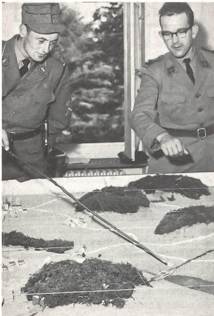
Lösen von Führungsaufgaben am Sandkasten

nachmaliger Zentralpräsident und Zentralsekretär, versah das Amt des Chefredaktors, das er bis zum Jahr 1953 inne hatte.