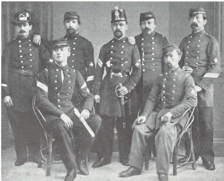
1. Zentral-Komitee Luzern 1864–1865

Die neuen Verhältnisse erforderten aber auch organisatorische Umstellungen in der Verbandsleitung. Ab 1923 wurde jedem Mitglied des Zentralvorstandes ein bestimmtes Ressort zur Bearbeitung und Überwachung zugewiesen und ein technisches Komitee gebildet, das sich mit der Ausarbeitung der Wettkampfglemente der zukünftigen Schweizerischen Unteroffizierstage und der periodischen Arbeitsprogramme zu befassen hatte. – Ein stetes Sorgenkind der Verbandsleitung war das Verbandsorgan «Der Schweizer Unteroffizier.» Eine 1927 erfolgte Fusion mit der ebenfalls nicht auf Rosen gebetteten Zeitschrift «Der Schweizer Soldat» war die Lösung. Dem «Schweizer Soldat» – so hiess das neue Blatt – wurde mit der Bildung einer Verlagsgenossenschaft eine gefestigte finanzielle Grundlage gegeben. Adj Uof Ernst Möckli,