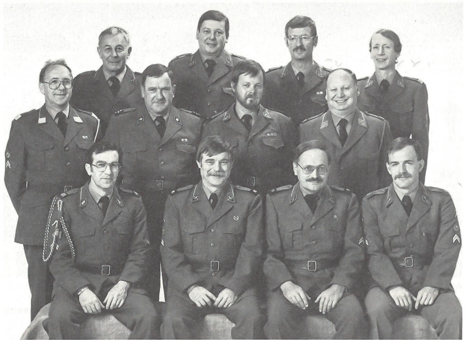
Der jetzt amtierende Zentralvorstand