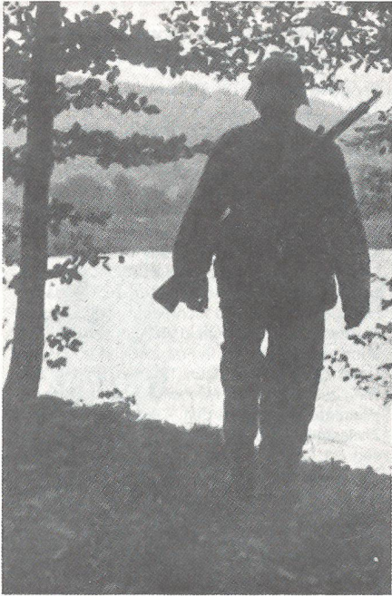
Wacht am Rhein: Die Zukunft wird unsicher, die Truppen sind rund um die Uhr im Einsatz.

Als Stellvertreter rutschte ich nun an seine Stelle. Trotz der gewissen Eintönigkeit des Dienstes war unsere Kameradschaft gut, was sich positiv auf die Moral auswirkte.