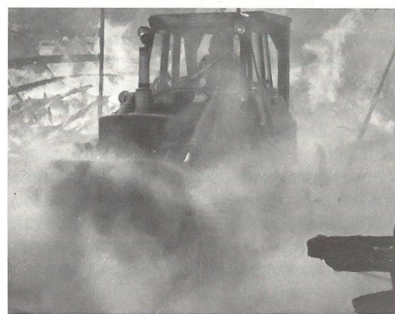
Baumaschine öffnet die Einsatzachse für die nachfolgenden Rettungseinsätze.