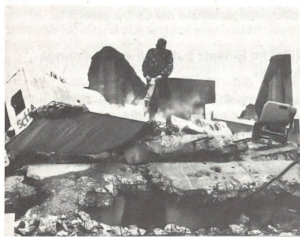
Ls Sdt mit Abbruchhammer im Trümmergelände