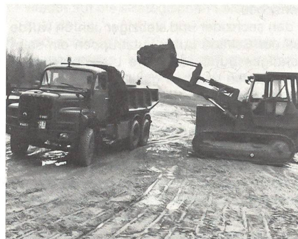
Einsatz von Baumaschinen, wie seinerzeit im Erdbebengebiet Südtaliens.