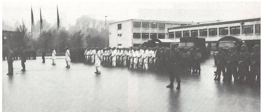
Die Ls Kp der Ls RS 77/89 stellte sich vor dem Einsatz auf dem Waffenplatz Wangen an der Aare vor. Rekruten aus 18 Kantonen stehen im Dienst. Die Parallelschule wird in Genf, mit den Teilnehmern aus den übrigen Kantonen, geführt.

Auf einer «Ausbildungsstrasse» in der «Bleiki» wurden in Gruppen die den Luftschutztruppen und dem Zivilschutz zur Verfügung stehenden Mittel dargestellt und in Aktion gezeigt. Beeindruckend wie, um einige Beispiele zu erwähnen, die Baumaschinen arbeiten, wie sich der Atemschutztrupp verhält, welche Kraft die Wasserwerfer erzeugen oder wie ein Soldat mit Abbruchhammer im Trümmergelände tätig ist.