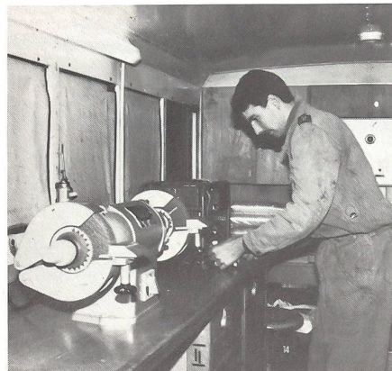
Einblick in den Werkstattswagen der Ls Trp.