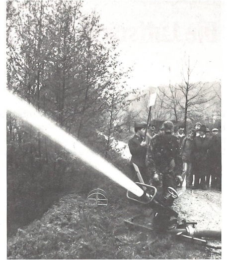
Wasserwerfer 83 im Einsatz (Wassermenge 2000 l/min mit einer Wurfweite von 60 bis 70 m.)