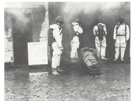
Atemschutztruppe im Einsatz