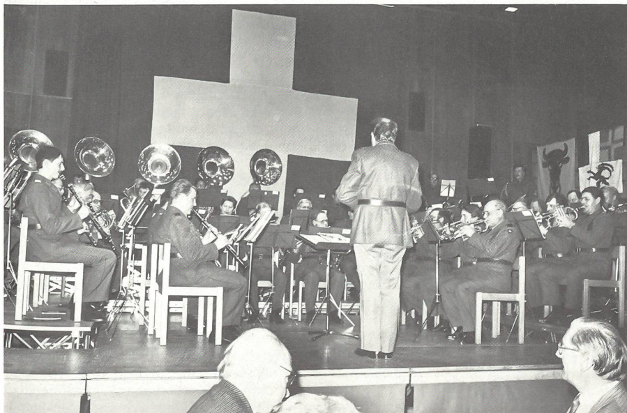
Konzert des Militärspiels des UOV Baden im Jahre 1987.

Für den Auftritt am Freitag, 17. März 1989 im Stadtkasino Baden können Plätze reserviert werden. Vorverkauf vom 5. bis 12. März täglich von 18 bis 19 Uhr über Telefon 056 22 77 41.