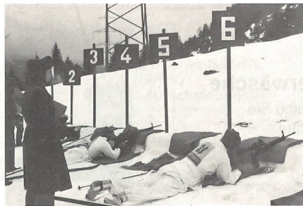
Auf der 15-km-Loipe wird zweimal mit Sturmgewehr ...