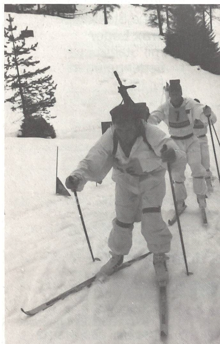
... wird mit vollem Einsatz gekämpft.