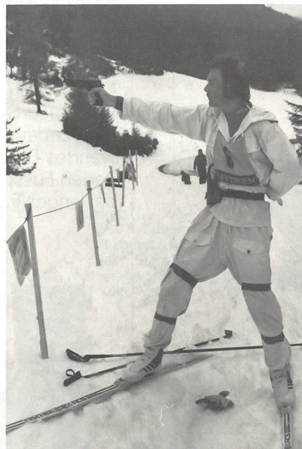
... oder mit Pistole geschossen.

über 15 km mit 9 kg Packung, wobei unterwegs je zweimal drei Schüsse mit dem Sturmgewehr auf feldmässige Ziele abzugeben waren.