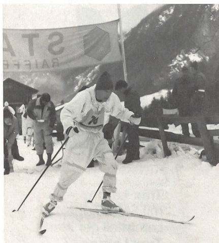
Vom Start weg ...

Der Mehrkampf A bestand aus einem Riesenslalom auf dem St. Margaretenberg. Mit Privatski und militärischem Schneeanzug waren 35 Tore zu durchfahren. Dazu kam im Gelände bei Vättis ein Langlauf