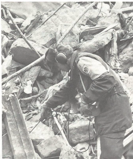
Österreichischer Soldat mit Ortungsgerät

Am 10., 11. und 13. Dezember konnten die Soldaten mit insgesamt 28 Tonnen Bergegerät, Medikamenten, Bekleidung und Verpflegung in das Erdbebengebiet transportiert werden. In dem Kontingent be-