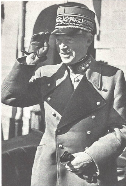
Unser General Henri Guisan, der zwei Tage vor der Kriegsmobilmachung 1939 von der Vereinigten Bundesversammlung zum Oberkommandierenden der Schweizer Armee gewählt wurde. Bild aus dem Buch «General Guisan» vom Fretz und Wasmuth Verlag, Zürich.

Mit diesen Veranstaltungen – hinter denen ein grosses Stück Arbeit steht – will das Projekt «DIAMANT» die ganze Bevölkerung der Schweiz, insbesondere die drei besonderen Zielgruppen Aktivdienst-Teilnehmer, junge Generation und Frauen ansprechen. Trotz bereits erfolgten Kritiken aus gewissen politischen Lagern («Wenn andere Länder den Frieden feiern, finden es unsere Militärs, offenbar am Platz, den Kriegsbeginn zu feiern») sind wir überzeugt, dass «DIAMANT» erfolgreich sein wird. Dass die Aktivdienst-Veteranen der Mobilmachung 1939 gedenken und das Jahr 1945 für den Frieden feiern werden, das können ihnen die Armeegegner nicht verwehren. Es ist ihr volles Recht. ☒