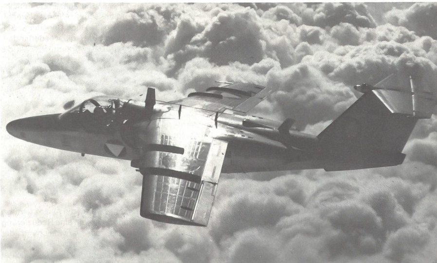
Der ab Ende der sechziger Jahre von Österreich beschaffte Typ Saab 105.

Erst Mitte der siebziger Jahre stand in Österreich die Abfangjägerfrage erneut zur Diskussion. Während der Jahre 1976 bis 1980 wurden die verschiedensten Flugzeugtypen für eine Beschaffung in Erwägung gezogen. 1981 scheiterte ein tatsächlicher Ankauf von 24 Flugzeugen der Type Mirage 50 nur am Finanzminister, dem es gelang, die Bundesregierung auf seine ablehnende Linie zu zwingen. 1983 endete die sozialistische Alleinregierungsperiode in Österreich, Bundeskanzler Kreisky trat zurück. Erstmals in der Geschichte der Zweiten Republik traten nun die Sozialistische Partei (SPÖ) und die Freiheitliche Partei (FPÖ) in eine gemeinsame Regierungskoalition; mit Dr Friedhelm Frischenschlager wurde ein freiheitlicher Politiker Verteidigungsminister. Zugleich mit diesem Innenpolitischen Wandel entwickelte sich die FPÖ zum Vorreiter in der Abfangjägerangelegenheit.