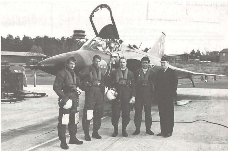
Ausbildung von österreichischen Draken-Piloten in Schweden.

Der Widerstand in Österreich gegen die sich abzeichnende Drakenbeschaffung ging quer durch die politischen Parteien. Die ÖVP, die deutliche Vorbehalte gegenüber dieser Beschaffung zeigte, wurde in dieser Frage in weiterer Folge nahezu gespalten, denn auf der einen Seite kämpfte der ÖVP-Landeshauptmann Krainer gegen die Abfangjäger, auf der anderen Seite musste sein Parteikollege, Verteidigungsminister Lichal, seit Jahresbeginn 1987 die Umsetzung dieses Drakenbeschlusses durchführen, nachdem die Koalition der SPÖ mit der FPÖ im Herbst 1986 ihr Ende gefunden und die ÖVP mit der SPÖ eine gemeinsame Regierung gebildet hatte. Die Unterzeichnung des Kaufvertrages mit dem schwedischen Konzern Saab-Scania am 21. März 1985 bildete sodann den Startschuss für heftige Auseinandersetzungen und Diskussionen in ganz Österreich. Zunächst wurde ein gesamtösterreichisches Volksbegehren initiiert, in dem sich eine allgemeine bun-