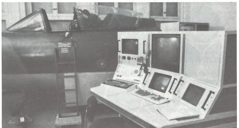
Der neue HUPRO in Dübendorf wird von den Piloten rege benützt.

Ebenso wird dem Instruktor die Möglichkeit eingeräumt, die einzelnen Sequenzen zu speichern und zusammen mit dem Flugschüler beliebig oft zu wiederholen. An Hardware wird ein VME-Computer-System mit total 5 Mikroprozessorkarten benötigt. Die Software besteht aus einem Echtzeit-Multitask-Betriebssystem, das auch die Synchronisierung und den Datenaustausch zwischen mehreren Prozessoren erlaubt. Programmiert wird dieses Graphiksystem in der Sprache PASCAL. Aus BAMF «info»