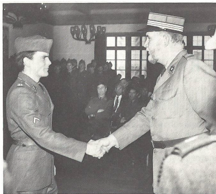
Der Lohn für vier Wochen harte Arbeit, die Beförderung.