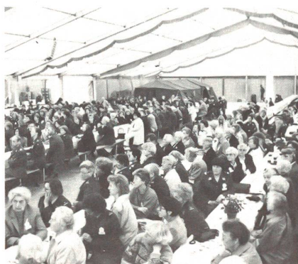
Blick ins Festzelt, im Hintergrund das Zelt im Zelt, die Nostalgie-Bar.