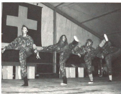
So fit sollte man sein!