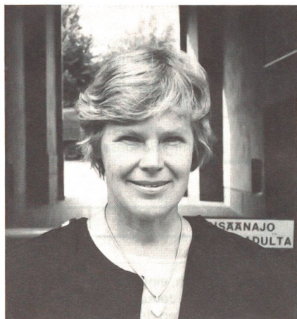
Elisabeth Rehn hat es gut. Als einzige amtierende Verteidigungsministerin der Welt kommandiert sie seit Juni dieses Jahres ein Heer von 27 000 Mann.

Rehn: Das kann ich persönlich nicht behaupten. Manchmal ist es auch leichter, einer Minderheit anzugehören, manchmal aber auch schwieriger. Die Frauen in der schwedischen Volkspartei (RKP), ich gehöre dieser Partei