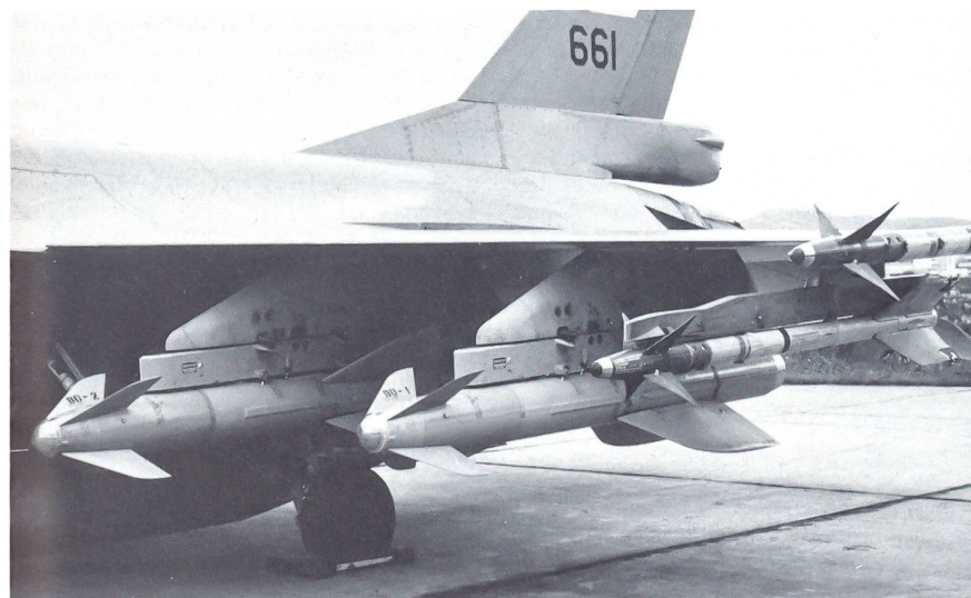
Hauptaufgabe der F-16 der 334. Staffel ist die Schiffsbekämpfung. Zu diesem Zweck sind sie mit der modernen Penguin, einer norwegischen Eigenentwicklung, Anti-Schiffslenkwaffe ausgerüstet.