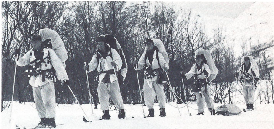
Eine wichtige Rolle in der Verteidigung Nordnorwegens spielen die Royal Netherlands Marines, die zusammen mit den britischen Royal Marines wohl zu den besten Elitetruppen innerhalb der NATO gehören. Im Bild zu sehen ist eine Skipatrouille der Netherlands Marines. Zu beachten ist das neue Steyr AUG Sturmgewehr, mit dem die Soldaten ausgerüstet sind.

Obwohl in Ost und West ein für alle Seiten befriedigendes Abrüsten und Tauwetter begonnen hat, wird an verschiedenen strategisch wichtigen Punkten dieser Welt weiterhin gefährlich aufgerüstet, vor allem von östlicher Seite. Zu diesen strategisch wichtigen Gebieten gehört die Nordflanke der NATO, insbesondere das Gebiet um Nordnorwegen. Im vergangenen Jahr stationierten die sowjetischen Marineflieger 40 modernste MiG-27 auf der Halbinsel Kola, nur wenige Flugminuten von Norwegen entfernt. Laut Angaben aus dem norwegischen Verteidigungsministerium sind dies die ersten Jagdbomber, die permanent auf der Kola-Halbinsel stationiert werden und bedeuten somit eine wesentliche Erhöhung des offensiven Potentials der Sowjets. Die 40 MiG-27 wurden 1990 aus dem ungarischen Fliegerhorst Debrecen abgezogen, als Teil der Abrüstung sowjetischer Truppen in Osteuropa.