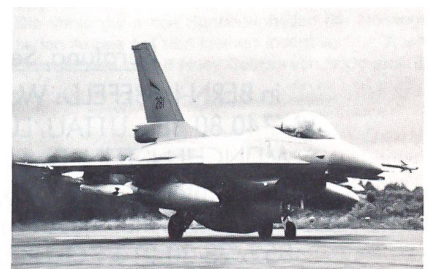
F-16A Fighting Falcon der 334. Staffel beim Start in Bodo

Das relativ kleine NATO-Mitglied Norwegen verfügt nur über relativ bescheidene Mittel zur Verteidigung seiner nördlichen Gebiete. Zurzeit wird allerdings auf Hochtouren am Ausbau von verschiedenen Stützpunkten Nordnorwegens gearbeitet. So wird der grösste und wichtigste Stützpunkt im Norden des Landes, Bodo, massiv ausgebaut. Es entstehen im Norden zwei neue Radarüberwachungsanlagen. Jährlich verlegen mehrmals Einheiten von anderen NATO-Staaten übungsmässig nach Nordnorwegen. So beteiligte sich schon zum wiederholten Mal die Allied Mobile Force (AMF) an Manövern in Norwegen. Zum erstenmal nahmen im Frühjahr 1990 Einheiten des Fallschirmjägerbataillons 262 der Bundeswehr an Übungen der AMF in Nordnorwegen teil. Vorher durften keine kombattanten Truppen der Bundeswehr norwegischen Boden betreten (Nachwehen Zweiter Weltkrieg!). Der AMF sind Einheiten von folgenden NATO-Staaten unterstellt: Belgien, Kanada, BRD, Italien, Luxemburg, Grossbritannien, USA und den Niederlanden. Besonders die Angehörigen der niederländischen Marineinfanterie und der Royal Marines aus England zeichnen sich jeweils durch