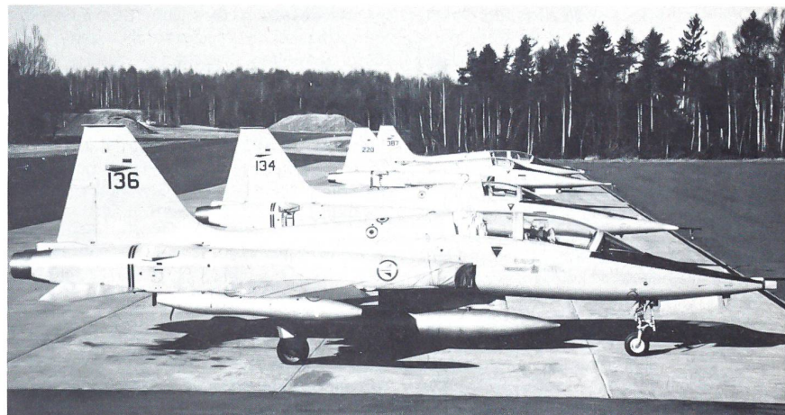
Zur Unterstützung der F-16 setzt die norwegische Luftwaffe einige betagte F-5A/B ein, die derzeit modernisiert werden. Sie sollen die F-16 vor allem im Bereiche der elektronischen Kriegführung unterstützen.

P-3C Orion III Royal Norwegian Air Force F-15C US Air Force F-4E Phantom US Air Force