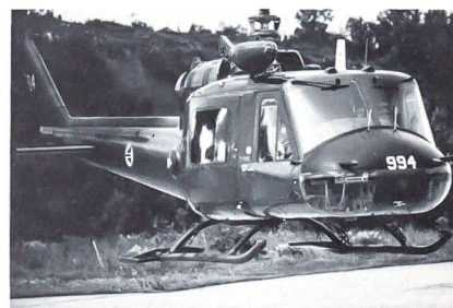
Die Versorgung von Sondereinheiten der Norwegischen Armee auf den kleinen Inseln vor der Küste übernehmen UH-1B Huey Cobras von Bodo aus. ☒

Ordnung und Pünktlichkeit sind wie eine Art Insektenpulver gegen die Friktion. Divisionär Edgar Schumacher (1897 bis 1967)