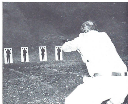
... knauernd ...