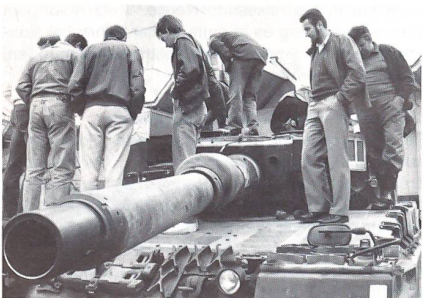
Aus der Nähe bestaunten die Mitglieder des UOV Büren den Leopard II, den neuesten Panzer der Schweizer Armee.

Vergleichsweise leise zeigte sich der neueste Panzer der Schweizer Armee, der Leopard II, auf der Thuner