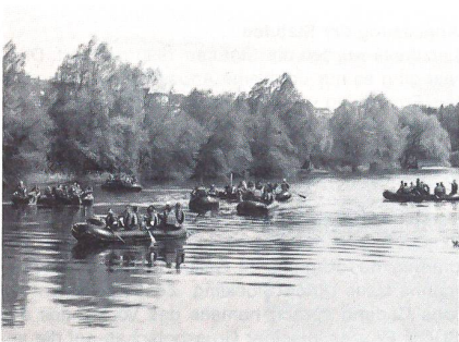
... an der 15. Reusstafahrt des UOV Emmenbrücke.

stolen und -gewehren, einem 3,5 km langen Radrennen, einem Theorietest und Flugzeugerkennung. Nach dem Mittagessen wurden die Boote wieder zu Wasser gelassen. Bei Jonen-Werd wartete die nächste Aufgabe. Bei der Führungslehre mit dem Thema «Angriff» musste ein 5-Punkte-Gesamtbefehl mündlich vorgetragen werden. Etwa 300 m von der Bootsanlegestelle entfernt gab Übungsleiter Michael Sauer die letzten Instruktionen für das abschliessende Wettrudern. Mit einem «Le-Mans»-Start spurteten die Bootsführer zu ihren Booten, ehe sie in einem packenden Rennen dem Ziel entgegenruderten. UOV Obwalden II landete hier einen wichtigen Prestigegewinn für Reiat. Nach der Materialabgabe schritt man zur Rangverkündigung, bevor alle sichtlich gezeichnet die Heimreise per Car antraten. Auszug aus der Rangliste: 1. UOV Reiat, 2. UOV Sursee, 3. UOV Willisau.