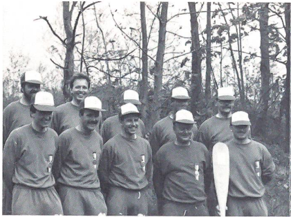
Die Bootsbesatzung des UOV Reiat siegte ...