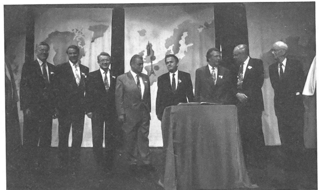
Der Bundesrat in corpore