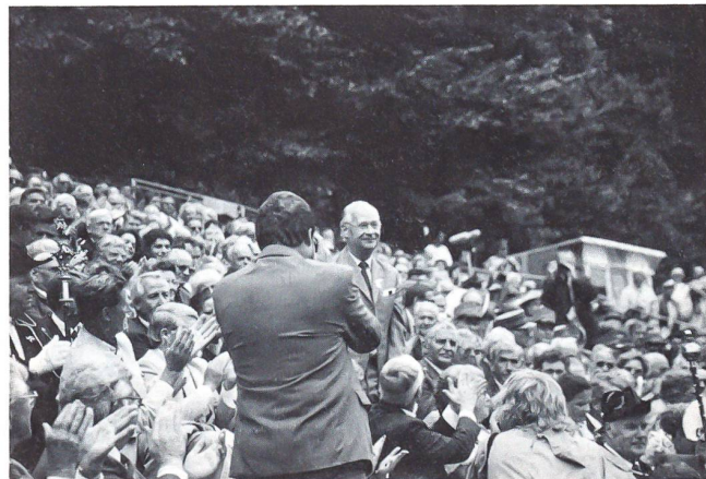
Alexander Dubček wurde speziell begrüßt und ertete grossen Applaus