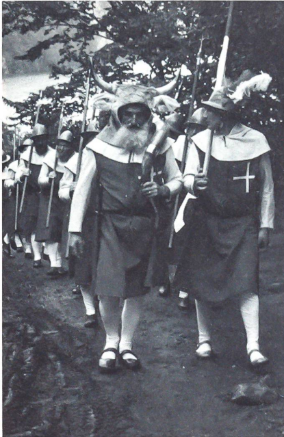
Auf dem Rütli, Einzug der Schwyzer

Die offizielle Schweiz feierte am 1. August an historischer Stätte in der Urschweiz den 700. Geburtstag unserer Eidgenossenschaft. Der Bundesrat in corpore, mehrere ehemalige Regierungsmitglieder, Spitzenvertreter aus Verwaltung und Parlament, Politiker aller 26 Kantone sowie prominente Persönlichkeiten aus Wirtschaft, Wissenschaft und Armee und 26 europäische Parlamentsvertreter bekundeten mit ihrem Kommen ihre Verbundenheit mit unserem Land.