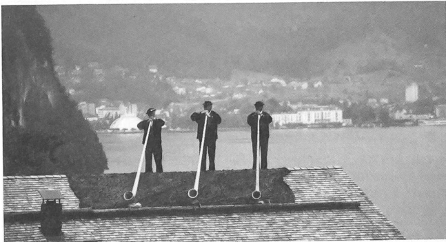
Alphornbläser gehören zu einem rechten Schweizerfest, links im Hintergrund das Botta-Zelt in Brunnen