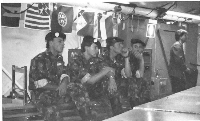
Helfer im Hintergrund