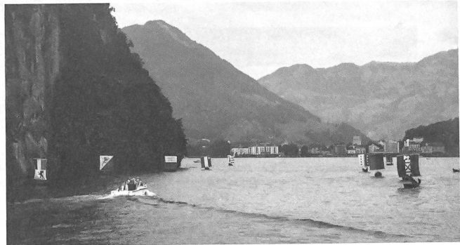
Die Nauen mit den Kantonssegeln, beidseits der Fahrinne der Schiffe, ergaben ein farbenprächtiges Bild

wir sie brauchen. Vorurteile sind fast immer falsch. Es wäre gut, wenn das alle Menschen einsehen würden, dann gäbe es sicher nicht mehr soviel Streit.