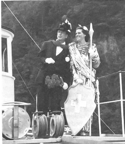
Die Helvetia durfte nicht fehlen!

Die vielen Höhenfeuer, die wir auf der Heimfahrt links und rechts der Strecke sahen, rundeten einen schönen, besinnlichen, feierlichen und auch fröhlichen Festtag ab.