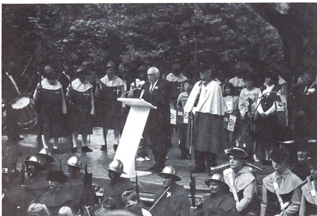
Nationalratspräsident Ulrich Bremi