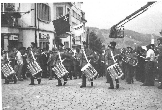
Impressionen vom Einzug in Schwyz.