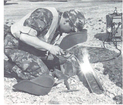
...und Schweißen müssen Eisenbahnsappeure ebenfalls können.

Die erste, im Frühjahr 1991 während 17 Wochen Dienst leistende Rekrutenkompanie des Militäreisenbahndienstes bestand aus je einem rund 20 Mann starken Gleisbauzug Deutschschweizer respektive Romands und einem etwa gleich grossen Zug von Fahrleitungsspezialisten.