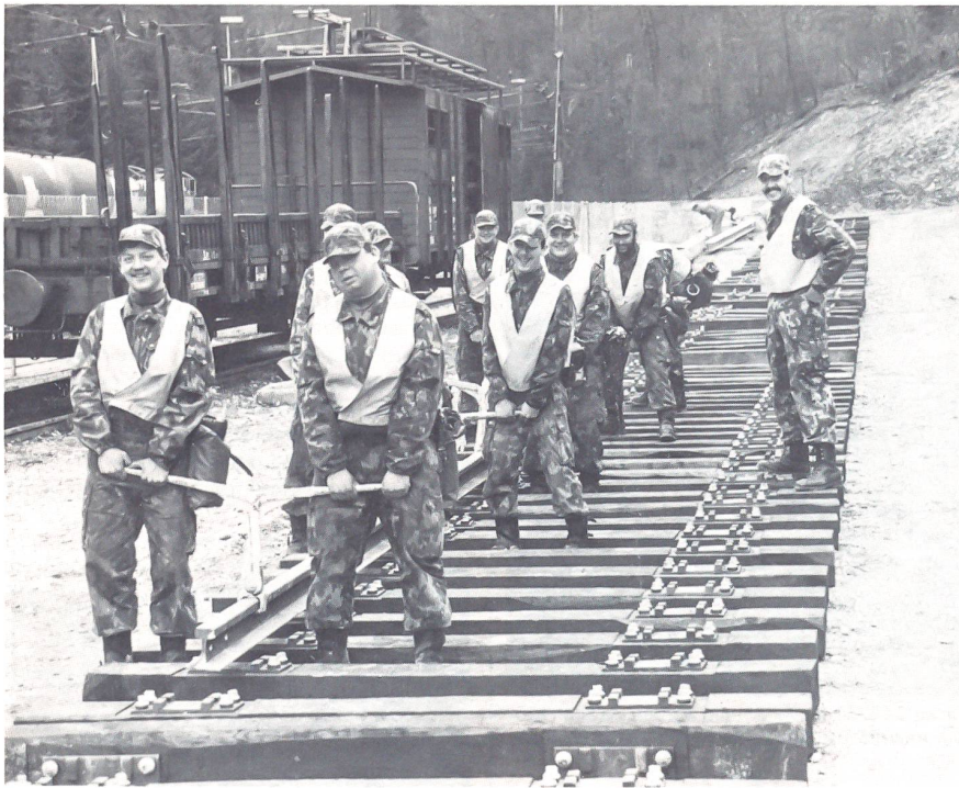
Die ersten vollwertigen Eisenbahnsappeure trainieren in Effingen den Gleisbau. Ohne Teamwork geht hier gar nichts.

Hoch- und Niederspannungsanlagen des Bahndienstes. Der Lehrkörper wurde zum Teil von den SBB ausgebildet. Die Militärinstruktoren stehen in engem Kontakt mit SBB-Beamten, die ihnen, wenn nötig, mit Rat und Tat zur Seite stehen.