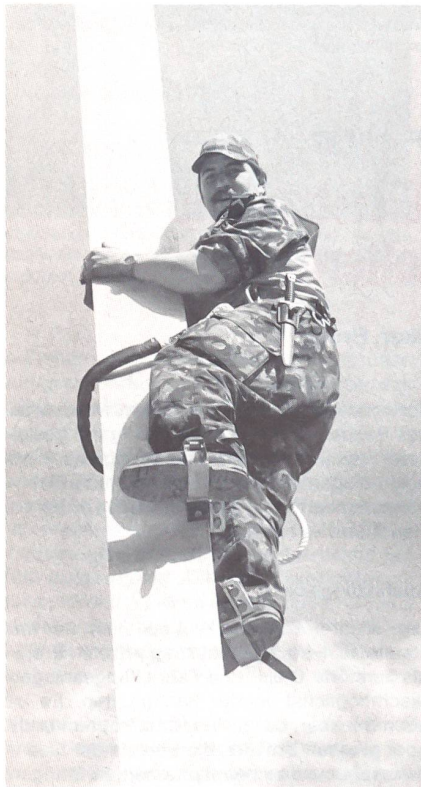
Auch die «Disziplin» Fahrleitungsmastenklettern will gelernt sein.

Schotter einbringen u a m. Wichtig sind aber auch die Fahrleitungssappeure. Sie können am Ende ihrer Ausbildung nicht nur (Bahn-) Masten stellen sowie Fahrdrähte und Tragseile spannen, sondern auch Übertragungsleitungsmasten für Hochspannungsleitungen «setzen». Unter einen Hut gebracht, versteht man unter der Fachausbildung der Eisenbahnsappeure die Ausbildung zum Gleisbauer, Fahrleitungsmonteur und zum Elektriker für