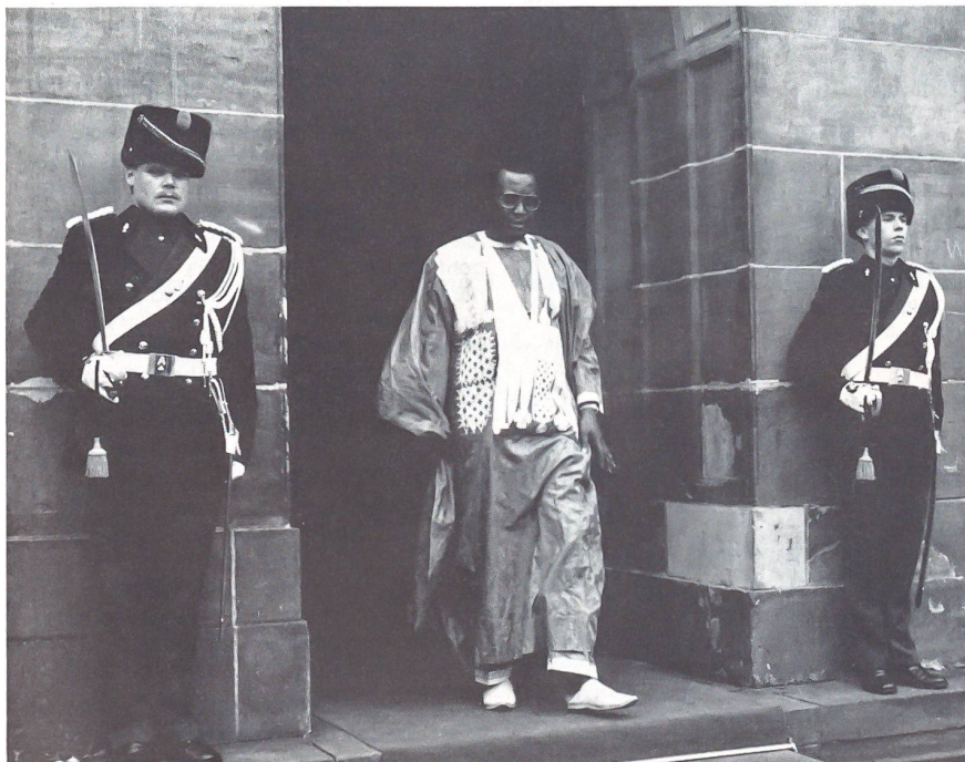
Afrikanisches und europäisch Traditionelles beim Palasteingang. Marechaussees in der Galauniform.

Die Palastwachen sind ebenfalls Angehörige der königlichen Marechaussee. Ihre Ausbildung ist jedoch nicht die gleiche wie bei den Spezialeinheiten. Ein Marechaussee der Palastwache leistet seinen Dienst immer nur bei den Palästen und dies genau vier Jahre lang. Nachher muss er den Beruf wechseln. Es ist aber nicht so, dass der Marechaussee nach