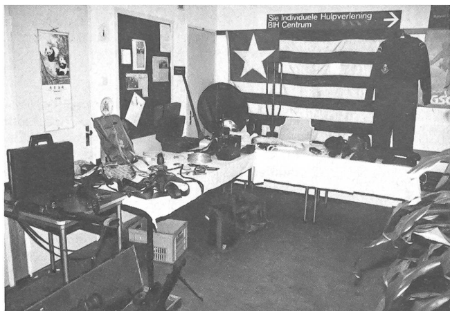
Material der Spezialeinheit (BSB).