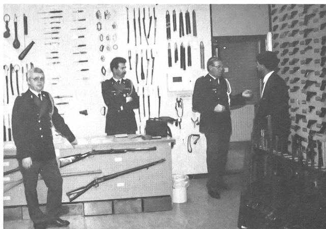
Blick in die Kammer beschlagnahmter Waffen der Kripeschule in Apeldoorn.

In fünf Sprachen mit einer Stadtkarte versehen, haben die Zettel folgenden Wortlaut: «Sie bekamen den Befehl, sich zu entfernen. Auch ist Ihnen befohlen worden, sich während acht Stunden nicht innerhalb des Gebietes, umgeben von nachfolgenden Strassen, zu begeben. Die beiden Seiten der Strasse gehören zu diesem Gebiet sowie der U-Bahnhof Neumarkt, die Zugänge und die Bahnsteige.»