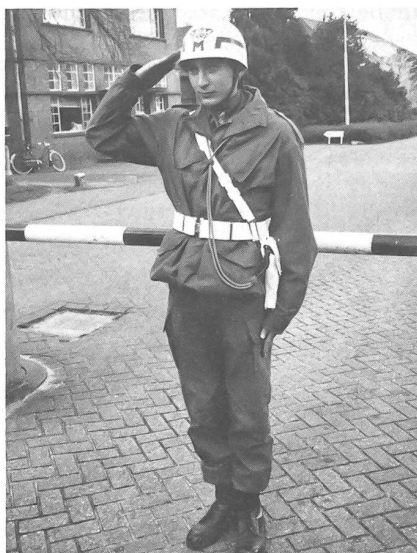
Ein wehrpflichtiger Marechaussee (Militärpolizei).

Die Aufgabe dieser Brigade besteht darin, die Personenkontrolle auf den ankommenden Schiffen durchzuführen. Für diese Aufgabe stehen dem Kommandanten 60 Marechaussee, davon 3 weibliche, und 10 Soldaten der