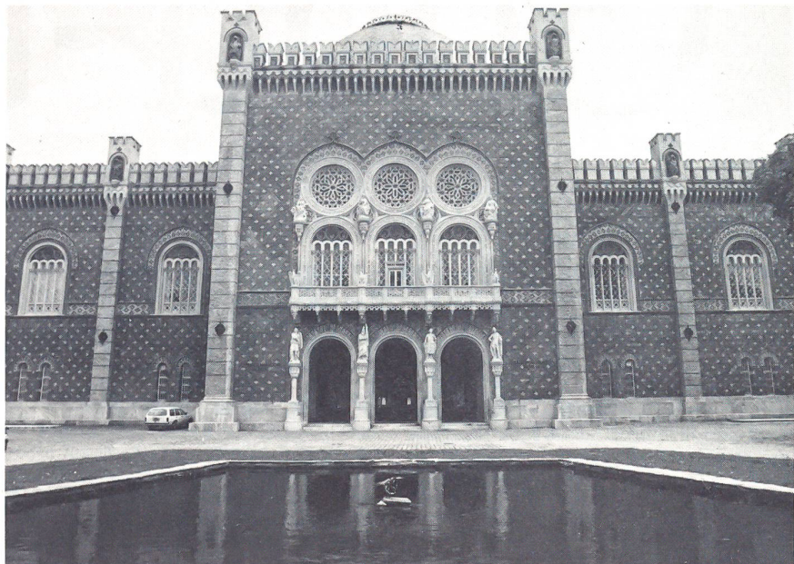
Eingang des Heeresgeschichtlichen Museums (HGM)

Schon Ende der fünfziger Jahre des vorigen Jahrhunderts setzte die museale Verwendung des Baues ein. Vor allem Waffen und Rüstungen aus dem kaiserlichen Zeughaus wurden hierher verlagert. Als 1881 das Kunsthistorische Hofmuseum (an der Wiener Ringstrasse) vollendet war und auch die Hofwaffen-sammlung dorthin transferiert wurde, verblieben im Arsenal nur noch ärarische Artillerieobjekte.