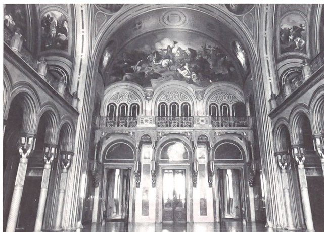
Ruhmeshalle (von einer 26,5 m hohen Kuppel überwölbt)

sammlung beginnt mit der Zeit des Dreissigjährigen Krieges («Saal des 16. und 17. Jahrhunderts»). Der Schauraum der Epoche Maria Theresias (18. Jahrhundert) umfasst sowohl Beginn und Aufstieg Österreichs zu einer Grossmacht als auch die Kämpfe der Herrscherin um die Erhaltung ihres Erbes. Den Kriegen gegen Frankreich zwischen 1792 und 1815 ist ein weiterer Saal gewidmet, ohne jedoch eine lückenlose Dokumentation aller Schlachten und Gefechte dieses Zeitraums zu bringen. Daran schliesst sich ein eigenes Erzherzog-Karl-Gedächtniszimmer an. Die im Gefolge der Revolution von 1848 ausbrechenden Kriege in Italien und Ungarn, die Feldzüge der Jahre 1859 und 1864, bilden eine weitere Abteilung des Museums. Dem Kriegsjahr 1866 ist am Ende dieses Schausaales («Vom Wiener Kongress bis 1866») ein eigener Abschnitt gewidmet. Auch die franzisko-josephinische Ära (nach Kaiser Franz Josef be-