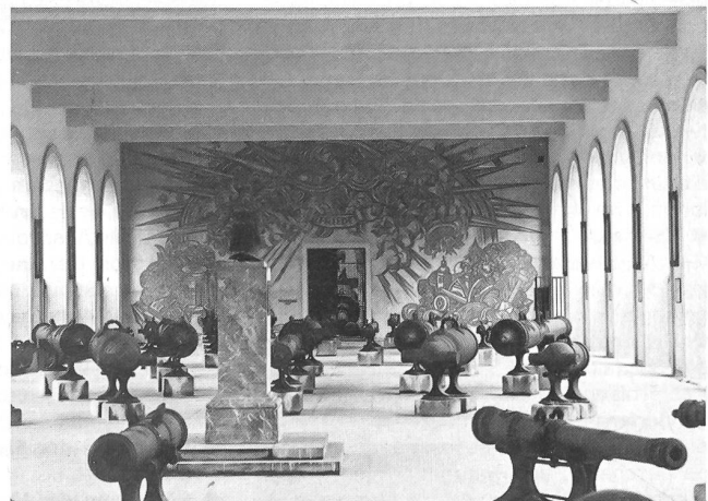
Teil des Rohrgartens

annt) ist in einem eigenen Saal vertreten («Die k.u.k.-Armee von 1867–1914»). Ferner finden sich neben Prunksälen, wie die Feldherrnhalle oder die Ruhmeshalle, Schauräume, in denen der Ermordung des Thronfolgerpaares in Sarajewo 1914 gedacht wird, in denen sich die Artillerie von der Mitte des 19. Jahrhunderts bis zum Ende des Ersten Weltkrieges darstellt, in denen ein Überblick über die österreichische Kriegsmarine und deren Leistungen vom Ende des 18. Jahrhunderts bis zum Jahre 1918 gegeben wird («Marinesaal») und in denen die Entwicklung der Luftstreitkräfte in Österreich dargestellt wird. Ein «Panzergarten» mit Panzertypen, die ab 1955 im Bundesheer Verwendung fanden, sowie ein «Rohrgarten» – eine Sammlung alter Geschütze mit nahezu 500 Rohren – runden die prachttolle Darstellung ab.