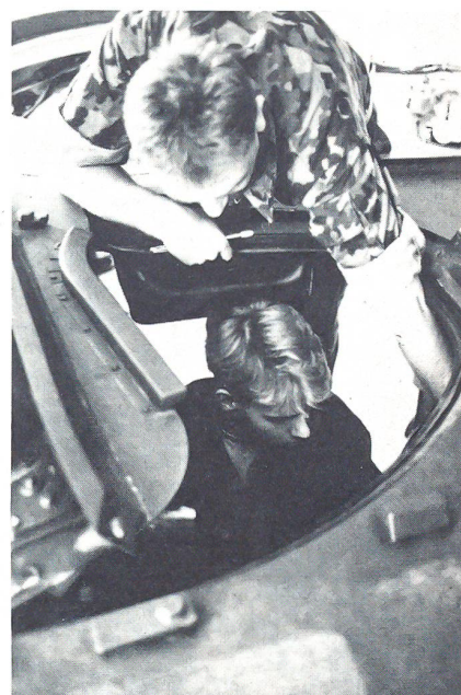
Panzer Fahrer in spe?

Nach den 50 Tonnen schweren Leoparden waren auf dem Militärflugplatz Interlaken die Pfeilschlanken Tiger-Kampfflugzeuge zu bewundern und zu betasten. Hier werden (oder wurden) unsere 110 Tiger alle 3 Jahre oder 300 Flugstunden während zweier Monate in zahlreiche Einzelteile zerlegt, auf Herz und Nieren geprüft und bis zur Neuwertigkeit hin revidiert. Bereitwillig wurden den Tessenberger Gästen die