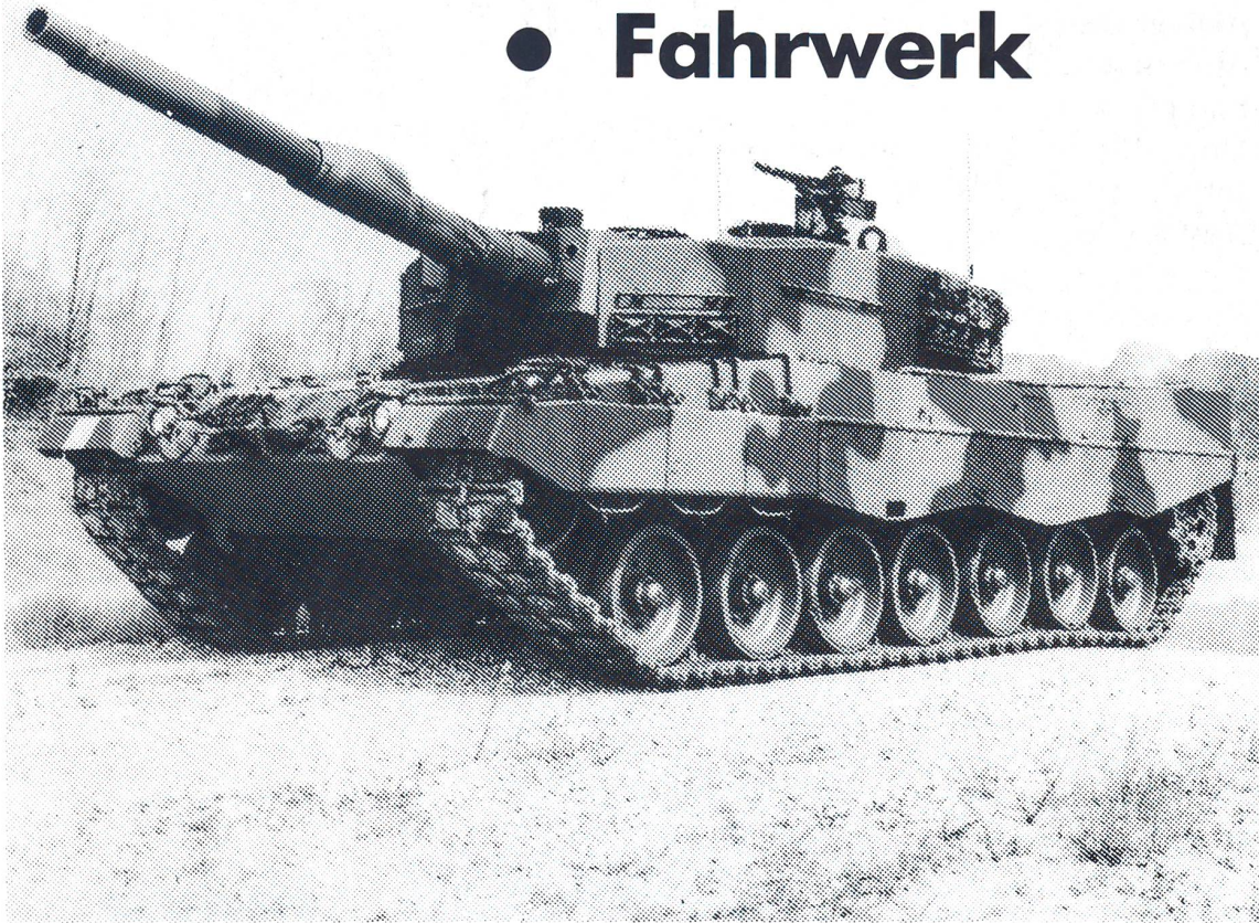
Pz. 87 Leopard 2