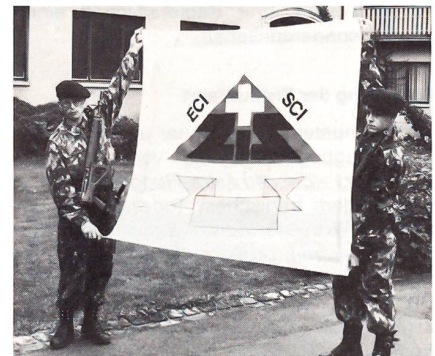
Mit Stolz wird die neue Fahne präsentiert

Unsere Armee braucht Ausbilder. Die rund 1000 Instruktionenunteroffiziere, es müssten