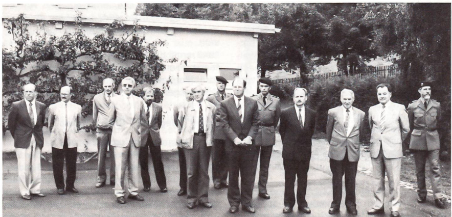
... und die Behördevertreter wohnen dem feierlichen Akt bei