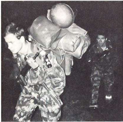
Mit Vollpackung unterwegs bei der Durchhalteübung