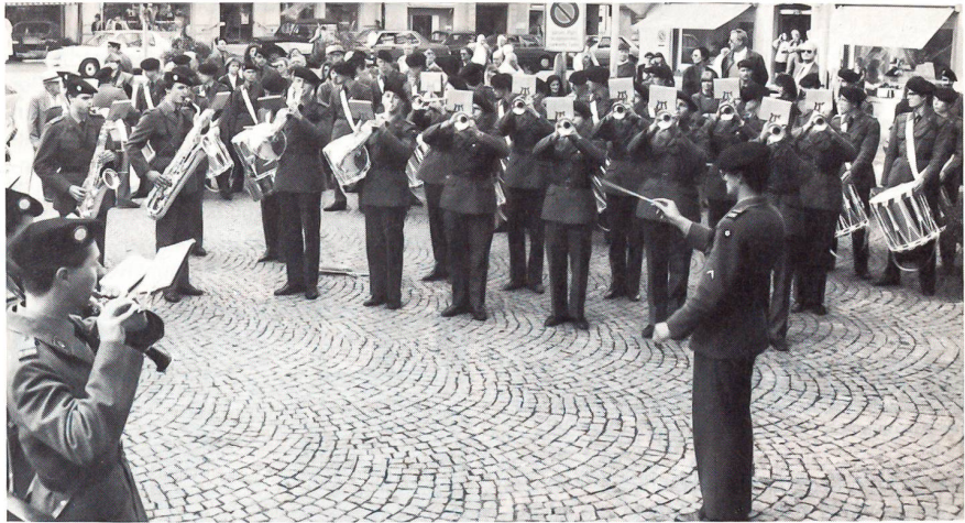
... und hier beim Konzert

200 bis 300 mehr sein, spielen als kleines Berufskorps in der personalintensiven Armee eine zentrale Rolle vor allem in der Ausbildung und Erziehung. Die Instruktoressen sind die eigentliche Basis für den Ausbildungsstand der Armee. Dies bedingt, dass ein Instruktor in methodischer, pädagogischer und psychologischer Hinsicht einen hohen Grad von Ausbildung mitbringen muss. Die auszubildenden Menschen wollen überzeugt werden, wozu nebst einer gründlichen und umfassenden Ausbildung beispielhafte Einstellung Voraussetzung ist.