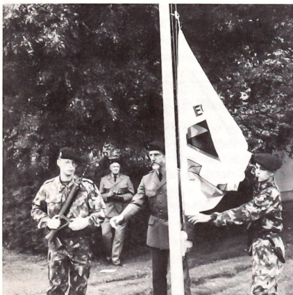
Die Fahne wird auf dem Kasernenareal gehisst

der benötigen. Die Schwerpunkte der Ausbildung liegen vor allem in den Bereichen allgemeines militärisches Grundwissen, psychologische und pädagogische Kenntnisse, praktischer Unterricht bei der Truppe, Förderung