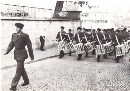
Das Spiel der Inf RS 206 im Anmarsch zur Diplomfeier