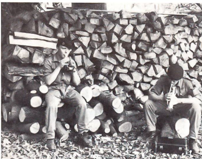
Trotz durchgestandener Anstrengung werden der Trompete vertraute Melodien entlockt. Ein Bravo!