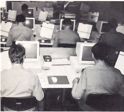
Die Absolventen bei der Informatik Ausbildung

des ganzen Programms wie ihre männlichen Kollegen. Kurz darauf traf bereits die zweite Patrouille ein und auch sie, trotz der grossen Leistung, in erstaunlich guter Verfassung.