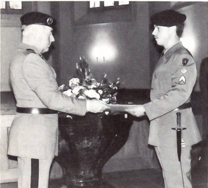
Oberst Greub konnte alle 40 Absolventen mit Handschlag und Überreichung der Diplome zu Instruktionsunteroffizieren befördern

Ständerat Otto Schoch gab in seiner Ansprache den brevetierten Instruktionsunteroffizieren einige grundlegende Gedanken auf den Weg. Auf den heutigen freudigen, festlichen Tag folge nun die Berufsarbeit, die nicht unter Dach, sondern bei jedem Wetter im Freien ausgeübt werden müsse. Die sinnvolle Ausbildung junger Leute sei aber eine freudvolle Arbeit, wobei aber verschiedene Aspekte und Gesichtspunkte zu beachten seien. Dem veränderten Umfeld, auch in der Armee, sei Rechnung zu tragen. Der Ausblick in die Zukunft sei keineswegs düster, mit Mut und Zuversicht könne sie gemeistert werden.