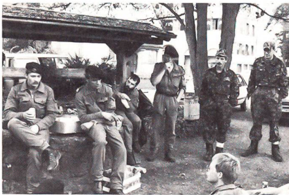
Nach den Strapazen folgt die wohlverdiente Ruhepause, auch eine Stärkung wird gerne entgegen genommen