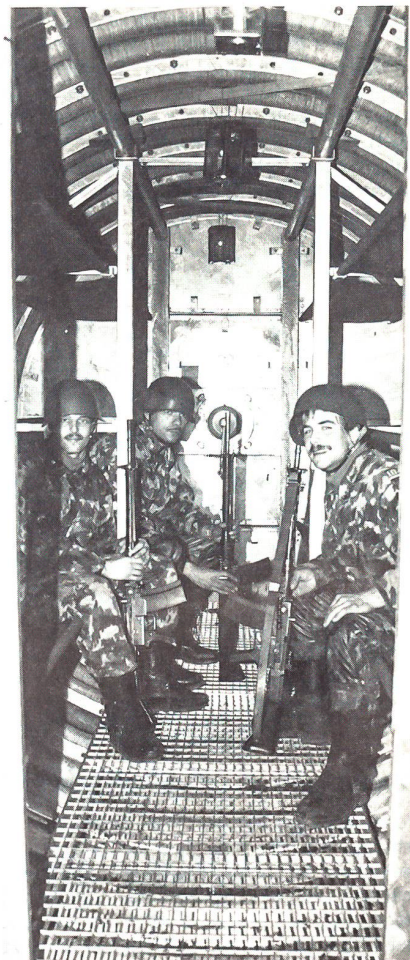
Drei Wehrmänner im neuen Feldunterstand 88 in Sicherheit. Es handelt sich um den vorfabrizierten Schutzbau von Dr Ing Koenig AG, Abt Schutzbauten Bild CH-Soldat I/89