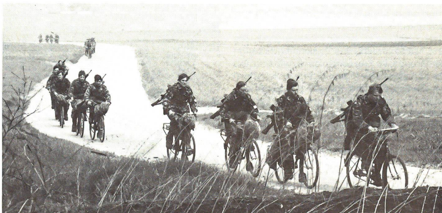
Der 200-Kilometer-Marsch: ein Höhepunkt in der RS

Das Mittagessen ist verbrannt. Was soll's? Am Nachmittag beginnt der Horror, total flache Strassen, keine erholsamen Abfahrten. Die Hitze macht allen zu schaffen. Doch mein Walliser «Grind» lässt mich nicht aufgeben. Es wird langsam Nacht. Und mit der Dunkelheit kommt auch die Kälte. «Wie weit noch?» – die immer wieder gestellte Frage. Man fühlt sich zeitweise recht einsam und allein gelassen. Die Teeversorgung klappt nicht gut, jedenfalls nicht gegen das Ende des Marsches. Beim letzten Halt ist die ganze Mannschaft dem Einschlafen nahe. Dann heisst es plötzlich, in etwa zwei Stunden sei das Ziel erreicht.