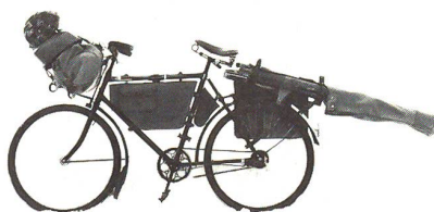
Schwer und robust: das beliebte Ordonnanzrad 05 mit aufgeschalltem Raketenrohr

Das heutige Ordonnanzrad (nur Banausen sprechen vom «Velo»)