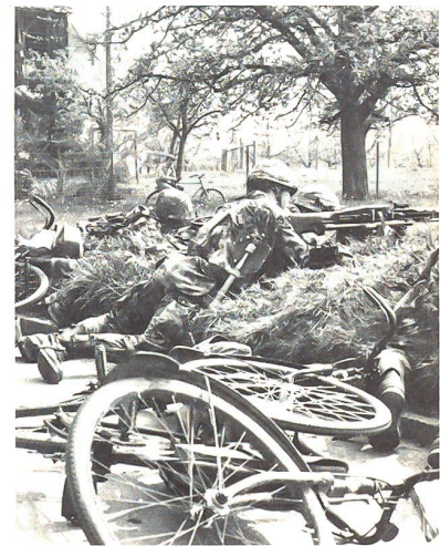
Rascher Übergang in das Gefecht: die Mitrailleurgruppe in Feuerstellung

Da in den erwähnten Gefechtsaufgaben der Regimentseinsatz kaum mehr die Re-