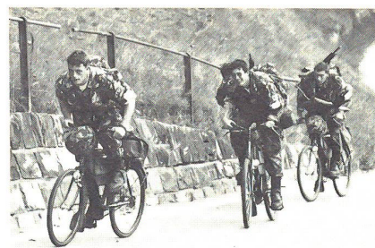
Kilometerlanges Auf und Ab, aber die Moral ist gut