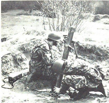
Die Ausbildung am 8,1-cm-Minenwerfer erfolgt ebenfalls in der Radfahrerschule