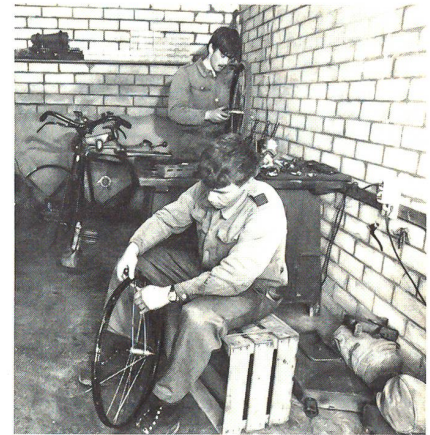
Arbeit in der Radwerkstatt

Lastenträger für das Maschinengewehr, die Maschinengewehrlafette, das Raketenrohr oder die Munition