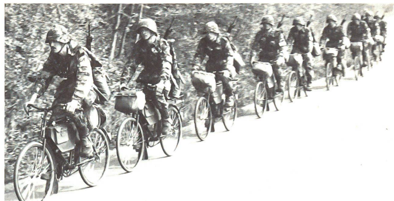
Eine Stärke der Radfahrer liegt in der lautlosen und raschen Verschiebung

gel sein wird, bedarf es auch einer neuen, angepassten Regimentsstruktur. Schwere Mittel, wie weitreichende Minenwerfer und Panzerjäger, wären nicht mehr erforderlich. Eine Beschneidung ihrer heute hohen Motorisierung und damit der möglichst artreine Einsatz von massgeschneiderten Radfahrerverbänden würde nicht nur ihre Mobilität steigern, sondern auch die Führung wesentlich vereinfachen.