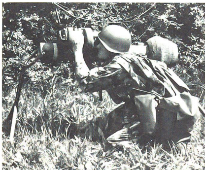
Der Dragon bildet die Hauptpanzerabwehrwaffe der Radfahrer

dentlich viele Spitzensportler (in der Rdf RS 226/90 rund 50!) und insbesondere zahlreiche Radrennsportler. Entsprechend positiv ist die Motivation und Leistungsbereitschaft der jungen Rekruten.