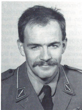
Auszug aus dem Lebenslauf

Diese Fehler werden dann in vielen Fällen von den übergeordneten Führern (Offizieren) dazu benutzt, die Unteroffiziere, infolge ihrer ungenügenden Ausbildung, zu diskriminieren. Viele Offiziere spielen leider noch heute ihre Überlegenheit am falschen Ort und im falschen Moment gegenüber ihren Untergebenen aus.