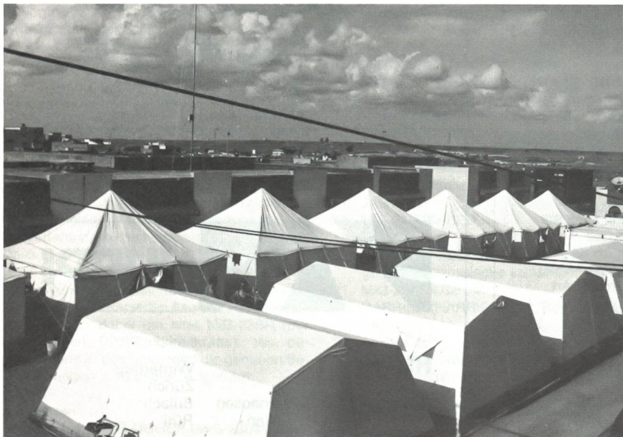
Die Zelte der Swiss Medical Unit in Laâyoune.