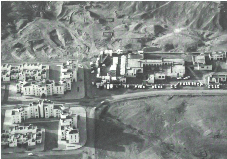
Die Klinik Laâyoune mit dem HQ «MINURSO» aus der Vogelschau