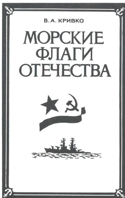
Titelbild des letzten sowjetischen Buches über die sowjetische Schwarz-Meer-Flotte.

Das 20. Jahrhundert war für die russische (und spätere) Schwarz-Meer-Flotte voll von Dramatik. Im Jahre 1905 rebellierten auf einem Kriegsschiff in Odessa die Matrosen. Sie machten wegen der mangelhaften Ernährung einen regelrechten Aufstand, ermordeten einige Offiziere und kaperten das Schiff, das den Namen der Fürsten Patjomkins trug. «Der Fall des Panzerkreuzers Patjomkin» machten die Bolschewiken zu einer Parteiliegende. Sogar der berühmte russische Filmregisseur Sergej Eisenstein hatte ein Filmepos