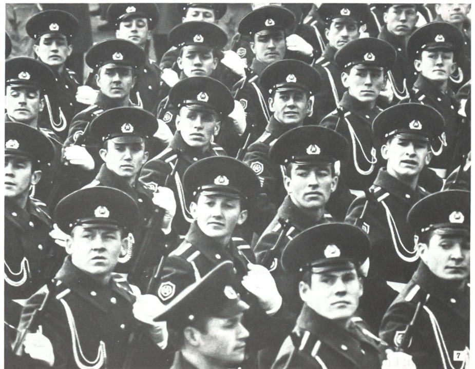
Parade von Angehörigen der Schwarzmeerflotte in Moskau 1988.

Nach den neuesten Nachrichten existiert die GUS-Armee bereits nur noch auf dem Papier. Präsident Jelzin hat Mitte Mai die Gründung einer eigenen russischen Armee bekanntgegeben. Das Schicksal der Kriegsflotten müsste nun doch noch in diesem Jahr endgültig entschieden werden. ☒