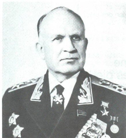
Flotten-Admiral SG Gorskow, mit Beinaemen der «rote Tirpitz», Oberbefehlshaber der Sowjetflotte in den siebziger Jahren.

Im Ersten Weltkrieg befehligte Admiral Koltshak die Schwarz-Meer-Flotte, und er war auch derjenige, der nach dem Zusammenbruch des zaristischen Regimes im März 1917 «Front» gegen die Bolschewiken machte. Später wurde der «weisse» General Dinikin