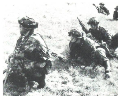
Gefechtsgruppe der Infanterie mit Trefferanzeigergeräten am Helm, welche auf einen Lasersimulator reagieren.

Im Zusammenhang mit aktuellen Fragen wird heute von den Medien sehr intensiv über Themen der Sicherheitspolitik berichtet. Die eigenständigen Informationsdienste der einzelnen Gesamtverteidigungsbereiche nehmen ihre Aufgabe auf offene und moderne Weise wahr. Es geht also nicht darum, die Quantität der Information noch zu vergrössern. Gerade ob der Menge der Tagemeldungen drohen aber die grundsätzlichen Zusammenhänge vergessen zu gehen. Hier setzt die ZGV als überdepartementale Stabs- und Koordinationsstelle ein. Im Verein mit den Informationsverantwortlichen der Gesamtverteidigungsbereiche muss sie die Grundlagen und Zusammenhänge unserer Sicherheitspolitik deutlich machen. Als Instrument dazu dient die «Koordinationsgruppe Information über Gesamtverteidigung», der unter Leitung des Informationschefs der ZGV die Vertreter der einzelnen Informationsdienste angehören.