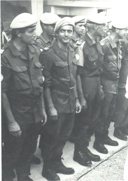
Angetreten wird nur bei « hohem Besuch ». Diese Uniformen der Sanitätssoldaten werden bald verschwinden. Für das Tropenklima in Kambodscha haben sie sich als völlig untauglich erwiesen.