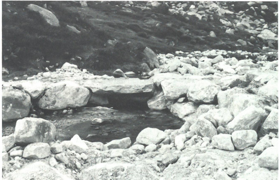
Der alte Wanderweg über den Gotthardpass. Genisten der Seilb Kp III/23 bauten diese Steinbrücke handwerk-mässig ohne Zement.