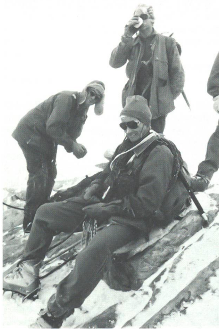
Zufriedene Gesichter auf dem 4158 Meter hohen Jungfraupitel.

Auch im dritten Detachement behalf man sich mit intensiver Eisausbildung auf dem Gletscher und mit einer Spaltenrettungsübung.