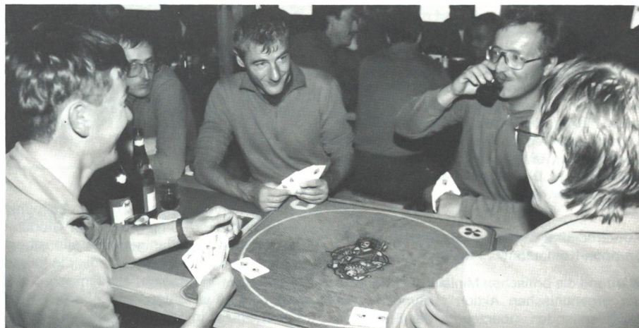
Hüttenstimmung bei einem gemütlichen Jass.