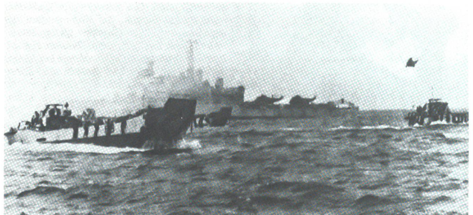
Am 21. Mai 1982 stürmten britische Soldaten von mehreren Booten aus bei Port San Carlos auf der Ostinsel an Land.

Während die britischen Minister und Politiker der argentinischen Aktion fassungslos gegenüberstanden, überzeugte der Erste Sea Lord, Admiral Sir Henry Leach, die Premierministerin Margaret Thatcher von der Möglichkeit einer erfolgreichen Rückeroberung durch die Royal Navy. Was den Kampfgruppenkommandanten betraf, so fiel die Wahl auf den jungen Konteradmiral Sandy Woodward. Dieser war am 7. Juli 1981 befördert und anschliessend zum Flaggoffizier der Ersten