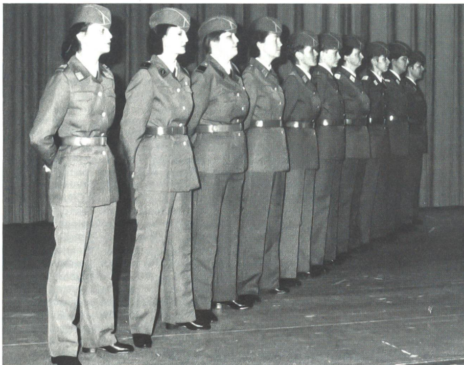
Die Aspirantinnen sind zur Beförderung angetreten.