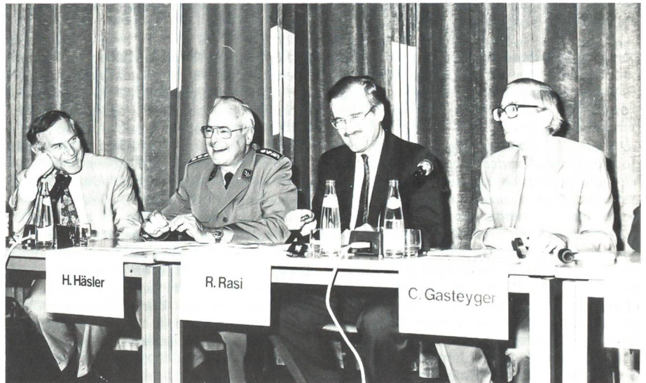
Am Schlusspodium gab es auch Grund zu Heiterkeit!

– Durch unsere Wohlstandsgesellschaft und den Informationsüberfluss der Medien sind wir träge geworden. Wichtige politische The-