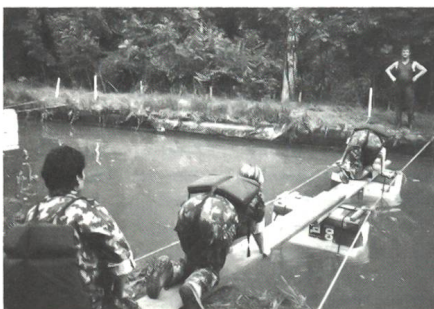
Kanalüberquerung oder «Wer fürchtet sich vor dem Schwarzen Mann?»

Der nächste Posten, hier wurde die Laufzeit neutralisiert, bestand aus Hindernisse suchen und Distanzschätzen. Wir bekamen das Foto eines Gelände-