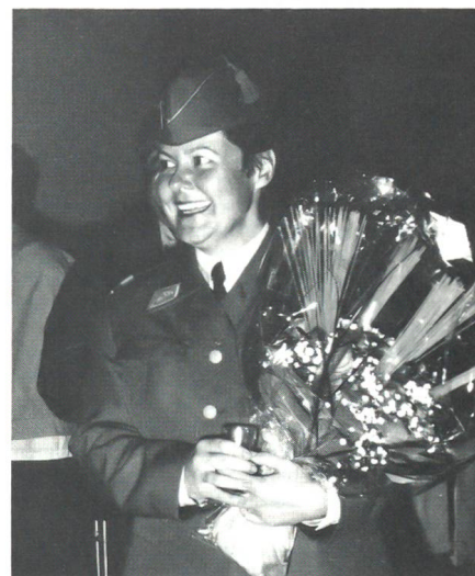
Die Spannung ist vorbei, nun bleibt Zeit, sich am «Spaghetti» und dem entsprechenden Strauss in Kreise der Angehörigen zu freuen!

Confiance d'abord à la vue de tant de jeunes femmes et hommes qui, loin des bla-bla pseudo-philosophiques et qui n'engagent à rien, à cent lieues des stratégies du café du commerce, font l'effort de payer de leur personne et de se manifester par des actes, acceptent des désagréments, voire des souffrances, pour participer à la vraie construction de notre avenir commun. Je connais les difficultés