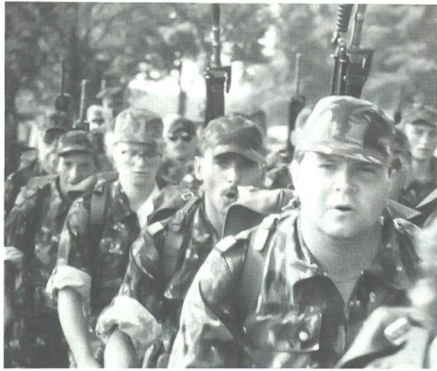
Der lange Aufstieg am dritten Tag vor dem kanadischen Friedhof in Groesbeek hat diese Teilnehmer der Marschgruppe der Mechanisierten und Leichten Truppen trotz bestem Training offensichtlich etwas gezeichnet.

starken Gewitter, das zwar abkühlte, aber auch eine drückende Schwüle hinterliess. Dennoch erreichte das Schweizer Bataillon vollzählig das Ziel, und die Blasen- und Fusspflege konnte beginnen.