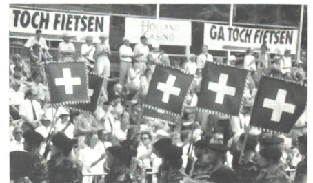
Jede der drei Schweizer Kompanien trägt im ersten Glied die Standarten der mitmarschierenden Gruppen voraus.

Der Freitag bedeutet für jeden erfolgreichen «Vierdaagser» die Krönung. Nach 35 Kilometern, auf denen nach den Städtchen Grave und Cuijk die Maas auf einer eigens erstellten militärischen Pontonbrücke gequert wird, wird beim Schuttershof, an der Peripherie Nijmegens, retabliert und das Tenue für den