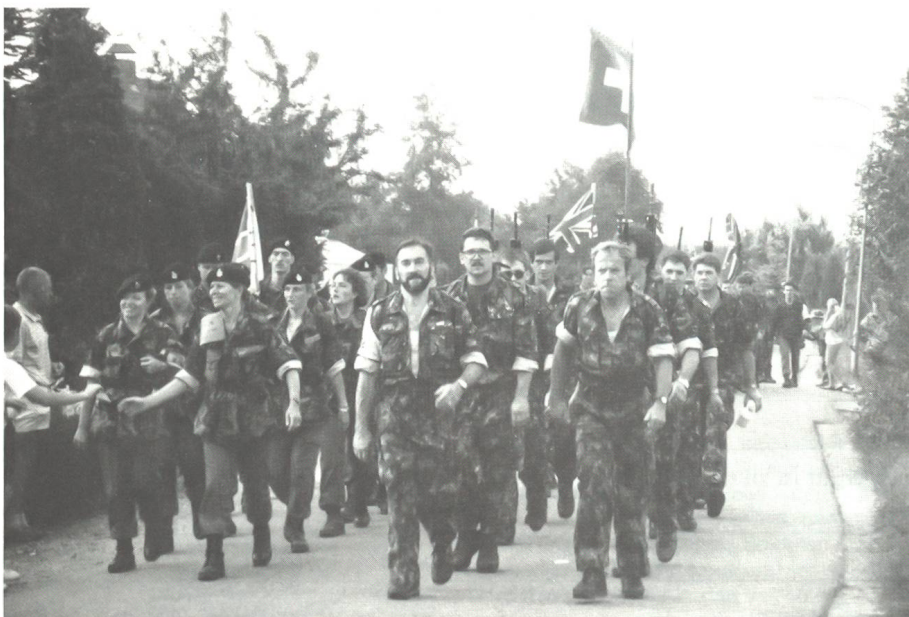
Zügig überholt die Marschgruppe «Argovia» kurz vor Lent in der Ebene zwischen Nijmegen und Arnhem ausländische Kameraden und Kameradinnen.

Am Dienstag galt es dann ernst. Zügig ging es kurz nach 6 Uhr zum Camp hinaus in die Stadt, dann über die grosse Waal-Brücke in die weite Ebene zwischen Nijmegen und Arnhem, durch die Kleinstädtchen Bommel, Elst und Oosterhout zurück zum Waal und hinauf ins Camp. 40 lange Kilometer, die Männer mit 10-Kilo-Gepäck einschliesslich des Sturmgewehrs oder der Pistole. In Bommel spielt traditionsgemäss ein Schweizer Musikkorps auf – diesmal der Musikverein Goldau, der die dortige «Switserse Week» belebte. Kurz nach dem Durchmarsch in Bommel öffnete der Himmel, der schon lange schwarz gedräut hatte, seine Schleusen zu einem prasselnden