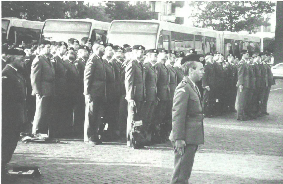
Sofort nach Ankunft des Extrazuges von Basel besammelt sich das Schweizer Marschbataillon zum Appell und zur Begrüssung auf dem Bahnhofplatz in Nijmegen.

Mindestens 300 Kilometer Training in heimischen Gefilden hat jeder Angehörige des Schweizer Marschbataillons in den Beinen sowie den Berner Zweitagemarsch am zweiten Mai-Wochenende, wenn sie oder er mit dem traditionellen Extrazug am Samstagabend ab Basel die Fahrt nach Nijmegen antritt. Dieses Jahr umfasste die Schweizer Expedition, von der Sektion ausserdienstliche Tätigkeit im Stab der Gruppe für Ausbildung organisiert, 255 Marschierer und Betreuer, darunter 21 Damen des Militärischen Frauendienstes und des Rotkreuzdienstes der Armee sowie eine zwölfköpfige Gruppe des Grenzwachtkorps. Nach dem Wiedersehen mit alten Bekannten in Basel folgte am frühen Sonntagmorgen auf dem Bahnhofplatz in der ehemaligen niederländischen Kaiser-Karl-Stadt die offizielle Begrüssung durch Oberst Bernard Hurst, im zweiten Jahr Chef der Schweizer Delegation.