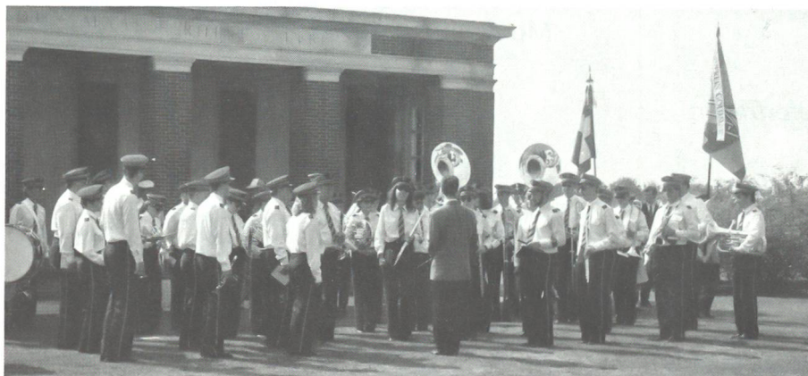
Die Kranzniederlegung durch die Schweizer Delegation auf dem kanadischen Militärfriedhof oberhalb Groesbeek wird traditionell vom Schweizer Musikkorps begleitet, das an der Schweizerwoche in Bemmel teilnimmt; hier das Korps der Musikgesellschaft Goldau (SZ).

Der dritte Tag ist am Viertagemarsch als die «Bergetappe» bekannt. Ein gutes Drittel des Schweizer Bataillons durfte schon kurz nach 4 Uhr starten, weil es an der traditionellen Kranzniederlegung auf dem kanadischen Soldatenfriedhof in Groesbeek teilnehmen wollte. Der grosse Harst zog erst kurz vor 6 Uhr aus dem Camp ab. Der Donnerstag sollte zu einer «Hitzeschlacht» werden, der dann auch ein Schweizer seinen Tribut zollen musste; vorsichtshalber wurde er von unseren Militärärzten aus dem Marsch genommen,