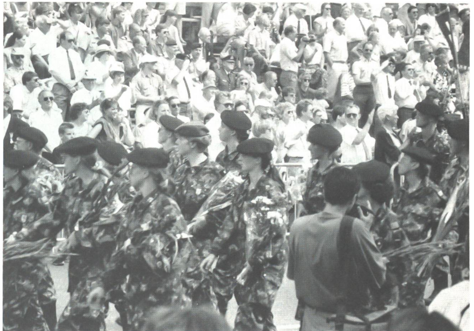
Den krönenden Abschluss der vier Tage bildet das Defilee vor Hunderttausenden von Zuschauern durch das Zentrum von Nijmegen. Vor der Ehrentribüne die Spitze des Schweizer Marschbataillons mit der Fahnenwache. Stolz tragen die Schweizerinnen die Gladiolen und anderen Blumen im Arm, die die Zuschauer zu Tausenden an die Marschierer verteilen.

obwohl er sich bald wieder vollständig erholte. Insgesamt erreichte die Zahl der Ausfälle am dritten Tag ungewöhnliche 1245 Teilnehmer.