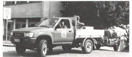
Einsatz eines Requisitionsfahrzeuges beim Zivilschutz.