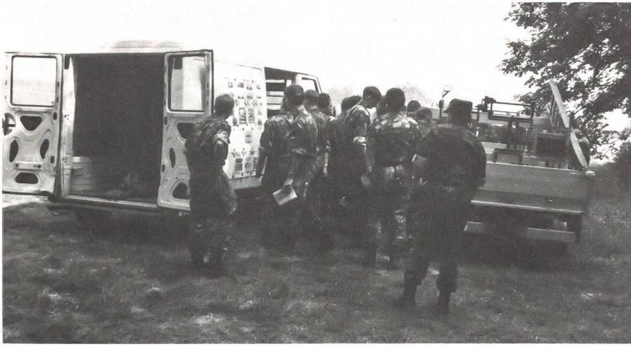
Der Umbau eines zivilen Fahrzeuges in einen Sanitätswagen wird den Aspiranten erklärt.

der Halter ein Protokoll, dessen Doppel dem Rechnungsführer als Grundlage zur Auszahlung der Entschädigung dient.