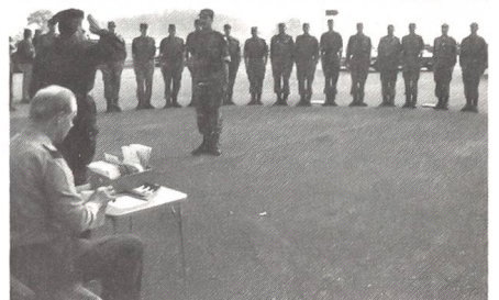
Appell der Aspiranten zum Instruktionstag «Fahrzeugrequisition».

Sanitäts- und Leitungsbauwagen müssen über genau passende Zusatzausrüstungen verfügen. Darum werden hier (und nur hier!) Bundesbeiträge ausbezahlt. Ein als Leitungsbauwagen vorgesehener Lieferwagen wird (von den Asp) mit den Bauteilen aus dem Korpsmaterial bestückt und mit der Zusatzausrüstung des Halters befestigt.