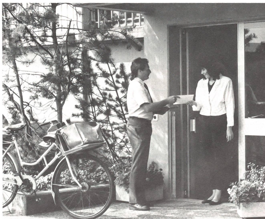
Empfang des Stellungsbehehls (neu Requisitionsverfügung) in Friedenszeiten.

Pw mit Normalantrieb werden, gemäss Zuteilung, direkt vom Einh Kdt belegt. Zur Auswahl stehen die Pw von Armeeingehörigen (AdA) der jeweiligen Formation, namentlich solcher mit Schlüsselfunktionen (Mat Of, Fw, Four usw). Mit einem grauen Spezialbehehl im