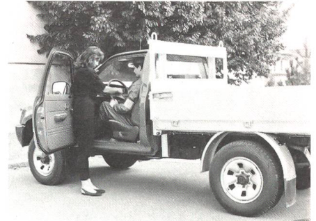
Übernahme des Fahrzeuges durch den Motorfahrer, Einführung in die Bedienung durch den zivilen Besitzer.