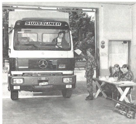
Zuteilung der einrückenden Fahrzeuge auf dem Zuteilungsposten.