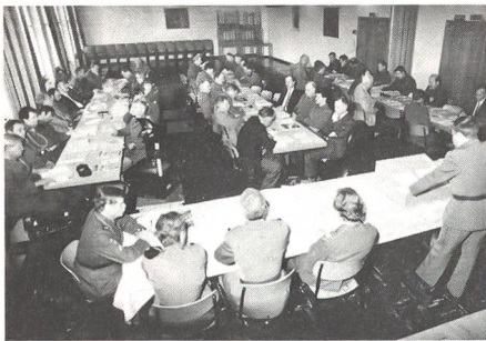
Die Präsidentenkonferenz im Kirchgemeindehaus Brienz.