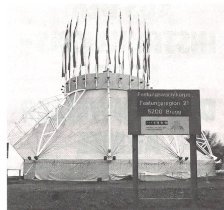
Botta-Zelt auf dem Bäumlhofareal in Basel.

erfolgten Räumung eines besetzten Areals ausgesprochen. So musste die Polizei bereit sein, es kam jedoch anders. Nicht die Basler Kulturgeländebesetzer erschienen, um die Abschlussfeier zu stören, sondern rund 50 Béliers. Die Separatisten aus dem Jura fing eine Schlägerei an. Ein Basler Polizeibeamter musste mit einem Kopfschwarzenriss, welcher von