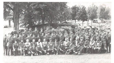
... und 1990 mit über hundert Wettkämpfern an den schweizerischen Unteroffizierstagen in Luzern.