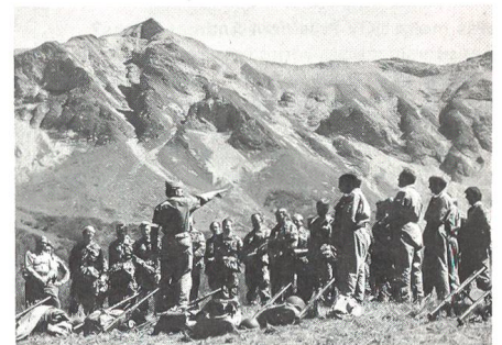
Der UOV Amt Erlach ist eine stolze UOV-Sektion: 1978 an der Kaderübung auf der Chleil-Alp im Diemtigtal ...

Zahlreiche weitere Vereinsaktivitäten sind für dieses Jahr geplant, zum Beispiel Besuch der Rekruten-