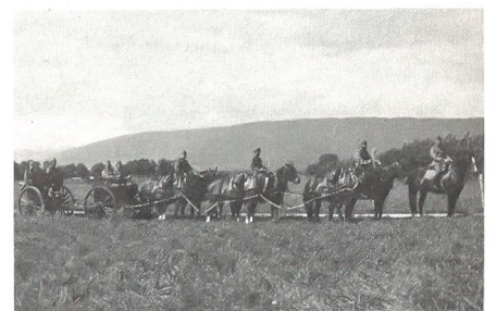
... 1983 am Umzug des Zentscheune-Festes ...