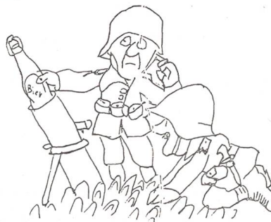
Auch ein Schuss Humor ist in der Jubiläumsschrift zu finden.

rischen Wettkämpfe zu geben. Obschon auch der 2. Seeland-Wettkampf dieses Jahr nochmals von der Sektion Erlach durchgeführt wird, ist für die Zukunft eine turnusgemässe Organisation geplant.