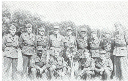
Aus der Vereinsgeschichte: Der UOV Amt Erlach 1961 an den schweizerischen Unteroffizierstagen in Schaffhausen ...