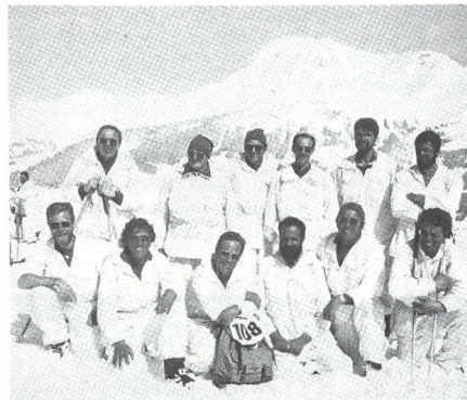
... und 1983 am Zweitage-Skilauf in der Lenk.

lenanlage erneuert, von der 50-m-Distanz auf die 25-m-Distanz umgestellt und mit zehn vollautomatischen Scheiben versehen. Beide Anlagen befinden sich auf dem Gelände der Strafanstalt Witzwil, wo auch eine schöne Schützenstube eingerichtet werden konnte. 1987 feierte die Sektion ihr 50jähriges Bestehen mit einem Jubiläumswettkampf und einem dankwürdigen Fest. Zu diesem Anlass erschienen viele Wettkämpfer aus der ganzen Schweiz und unter den eingeladenen Gästen ausserordentlich viele Prominente.