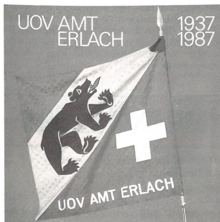
Der UOV Amt Erlach konnte 1987 sein 50jähriges Bestehen feiern.

Die letzten Jahre sind reich an Höhepunkten im Vereinsleben des UOV Amt Erlach. In den siebziger Jahren wurde eine Normkampfbahn mit 18 Hindernissen gebaut, und in den achtziger Jahren wurde die Pisto-