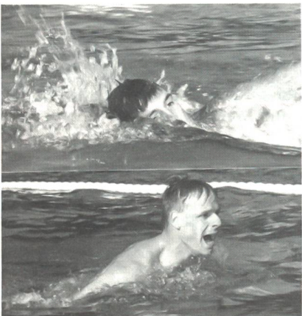
Der Schwimmstil spielte keine Rolle, nur die Geschwindigkeit.