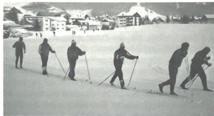
Eine Anfängerklasse beim Aufwärmen.