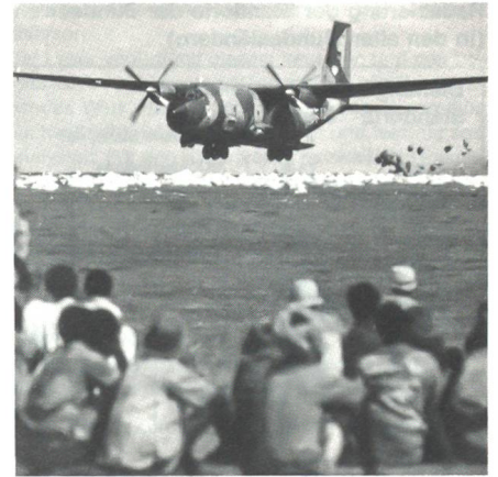
Abwurf von Hilfsgütern im Sudan.

nen im Vorjahr wurden 1991 30 000 Tonnen befördert. Die Anzahl der Passagiere, die mit der Luftwaffe flog, verdoppelte sich von rund 200 000 auf 390 000, vor allem durch den Behördenshuttle Bonn – Berlin. Die Rekordzahlen kamen durch die Unterstützungsaktionen für die Alliierten während des Golgkrieges und die nachfolgende Kurdenhilfe zustande. Schon im Vorfeld des Golgkrieges wurden im Mittelmeerbereich Lufttransporte zur Entlastung und Unterstützung der NATO-Partner durchgeführt. Insgesamt kamen 116 000 Flugstunden von Oktober 1990 bis Juli 1991 zusammen. Im Anschluss an den Golgkrieg und den Rücktransport des Personals wurde das Lufttransportkommando sofort in neue Ereignisse im Rahmen der Kurdenhilfe in der Türkei und im Iran einbezogen, wo auch mehr als 5500 Stunden in den Lufte verbracht wurden.