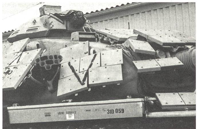
Ein Kampfpanzer des amerikanischen Typs M-60 A3, wie er von Teilen der 1. und 2. Marineinfanteriedivision eingesetzt wurde. Diese beiden Verbände waren aus Süden zwischen den zwei arabischen Korps auf Kuwait gestossen. Der Turm ist mit zusätzlichen Stahlplatten versehen, um Hohlladungsgeschosse vorzeitig zur Explosion zu bringen.