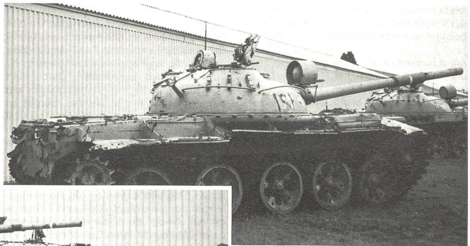
Zur Ausrüstung der Streitkräfte Saddam Husseins gehörten auch Kampfpanzer des ehemals sowjetischen Typs T-62.