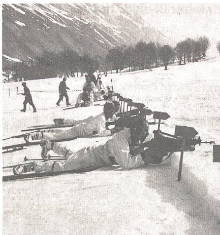
Stimmungsbild vom Schiessplatz.

Bei Annahme der Initiative durch Volk und Stände könnten bis zum 31. Dezember 1999 keine neuen Kampfflugzeuge beschafft werden. Ein Ja zu dieser Initiative hätte zur Folge, dass wir die nächsten 10 bis 15 Jahre gegenüber Bedrohungen aus der Luft praktisch wehrlos wären. Die Chancen unserer Erdtruppen, in einem modernen Konflikt bestehen zu können, würden dadurch praktisch aussichtslos. Die bei einer Annahme der Initiative zur Disposition stehenden 3,5 Milliarden Franken würden im Rahmen des ordentlichen EMD-Budgets für andere Beschaffungsvorhaben verwendet und kämen nicht, wie von gewissen Kreisen suggeriert wird, Rentnern und Hilfsbedürftigen oder dem Gesundheits- oder Bildungswesen zugute. Die Beschaffung eines neuen Kampfflugzeugs bewirkt keine zusätzliche Belastung der Bundeskasse und hat auch keine Steuererhöhung zur Folge. Genauso wenig führt eine Nichtbeschaffung zu einer Steuersenkung.