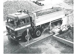
MOBY DICH Reifenwaschanlagen und Radreinigungsanlagen für LKWs