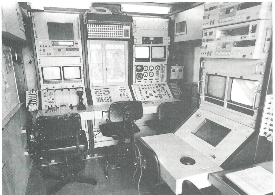
ADS-90-Einsatzkontrollstelle mit vier Arbeitsplätzen. Von links für Nutzlastbediener, Navigation-/Flugsicherung, Pilot und Benutzer (Nachrichten-, Artillerie- oder Fliegerleitoffizier).

Organisatorisch sollen durch die Schaffung einer operativen Verfügungstruppe der Armee in Form von zwei Panzerbrigaden, auf Stufe der Feldarmee durch Ersatz der Mechanisierten Divisionen durch je eine Panzerbrigade mit etwa 70 Kampfpanzern Leo 87 und der Aufstellung je eines Korps-Artillerieregimentes die nötige Handlungsfreiheit geschaffen werden. Mit dem korpseigenen Artillerieregiment soll insbesondere der operative Feuerkampf geführt werden. Die permanente Kampfinfrastruktur der aufgelösten 14 Brigaden und ein Teil des dafür benötigten Personals werden in einem Festungsregiment zusammengefasst und im Einsatzfall den kombattanten Truppen des jeweiligen Abschnittes unterstellt. Das Gebirgsarmee Korps behält seine drei Gebirgsdivisionen, die in Zukunft indessen nur noch aus je zwei Infanterieregimentern bestehen sollen. Das Korps verfügt