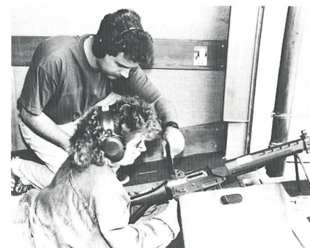
Betreut von insgesamt 1100 Jungschützenleitern schossen die 5600 Jungschützinnen und Jungschützen ihr Programm.

Auf dem Schiessplatz Hau und in den beiden Aussonden von Mauren und Märstetten ging am Sonntagnachmittag, 3. Juli, das 1. Schweizerische Jungschützenfest zu Ende. Eine erste Bilanz des verantwortlichen Organisationskomitees unter der Leitung von Präsident Hanspeter Ambühl zeigt, dass der Anlass – dies entgegen einigen Befürchtungen aus den Reihen der Verbandsspitze des Schweizerischen