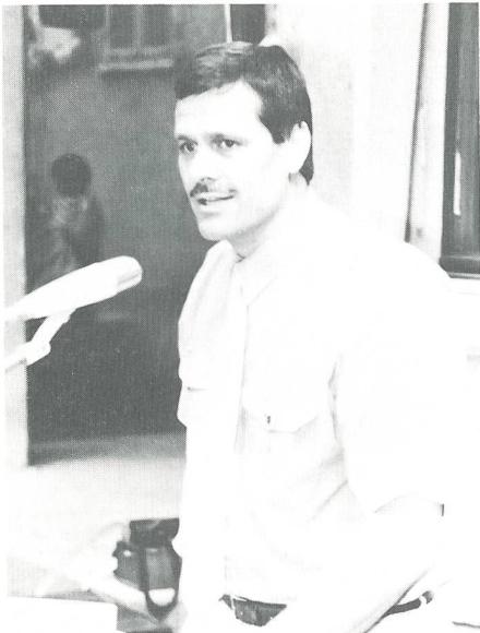
Regierungsrat Roland Eberle zeigte sich erfreut darüber, dass dieser erstmals durchgeführte nationale Anlass im Thurgau stattfand.