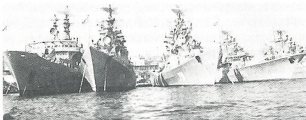
Zerstörer und Schlachtschiffe der Schwarzmeerflotte der GUS am Marinestützpunkt Sewastopol.

Offiziell geht es heute in erster Linie um die Schwarzmeerflotte und ihre Stützpunkte. Darüber wird schon lange auch auf höchster Ebene verhandelt, und das Ende dieser Verhandlungen und deren Ergebnis sind nicht absehbar, aber praktisch wäre das Problem lösbar. Schlimmer steht es mit der Zugehörigkeit der Krim bzw ihrem Verhältnis zur Ukraine und zu Russland.