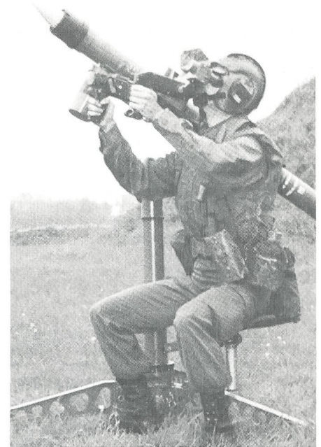
«Mistral», Leichte Fliegerabwehr-Lenkwaaffe

Mit zwei Sondermarken gedenkt auch Frankreich des 50. Jahrestages der Invasion, womit das Ende von Hitlers «Festung Europa» eingeläutet wurde. Eine