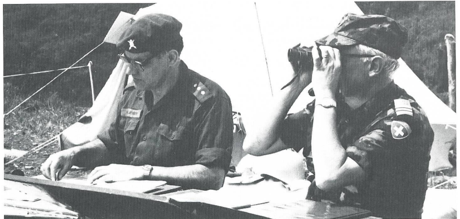
Bereits zum dritten Male führte die Abteilung Friedenspolitische Massnahmen auf den Frauenfelder «Golanhöhen» einen UNO-Militärbeobachterkurs durch.

Diese Art der Friedensförderung, wie sie auch im neuen Armeeleitbild festgehalten wurde, sei nichts Neues, meinte Siegenthaler. Bereits seit 1953 hätten allein in Korea 746 Schweizer Militärbeobachter Einsätze geleistet.