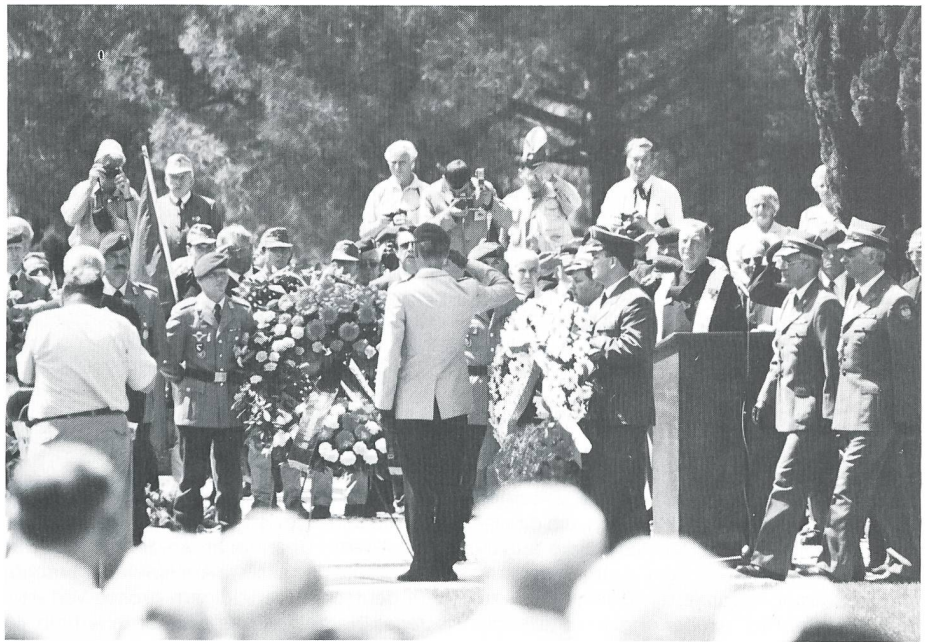
Deutsche Gedenkfeier mit englischem Feldprediger und polnischer Delegation.

Viele Hunderte von Veteranen waren aus der ganzen Welt angereist, um der Toten zu gedenken. Die blauen Turbane der Inder waren an der offiziellen deutschen Gedenkfeier zu sehen, ehemalige deutsche Fallschirm- und Hochgebirgsjäger nahmen an der Commonwealth-Feier teil. Am Dienstag war der französische Tag, am Mittwoch der polnische. Ein weiterer Tag war offiziell für alle gemeinsam gedacht, und gegen Ende der Woche feierten die Amerikaner auf ihre Weise, immer alle mit den ehemaligen Gegnern und Verbündeten, mit denen sich aus dem gemeinsam Erlebten trotz Sprachschwierigkeiten rasch herzliche Gespräche ergaben. 50 Jahre nach der grössten Völkerschlacht des 2. Weltkriegs, an der auf alliierter Seite 26 Nationen teilgenommen haben sollen, Deutsche, Österreicher, Amerikaner, Engländer, Neuseeländer, Inder, Franzosen, Marokkaner, Algerier, Tunesier und viele andere. Eindrücklich ist diesbezüglich neben dem britischen auch der französische Friedhof in Ve-