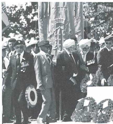
Angehörige der 4. Indischen Division an der Commonwealth-Feier.

Trotzdem fühlte sich der 79jährige Abt des Klosters sicher, nicht nur wegen der meterdicken Mauern, sondern auch weil er sich nicht vorstellen konnte, dass der Krieg so grausam und primitiv sein konnte, auch sein Kloster mit den unschätzbaren Kulturgütern zu erfassen. In der Tat blieb das Kloster vor-