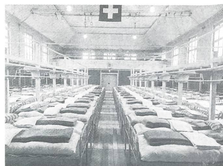
1940 bis 1946 wurde die Herrengass-Turnhalle von der Truppe als Kantonement benutzt.

Das vereinigte Kommando der Materialtruppen-Kaderschulen (OS/TSK) wird in der Kaserne einquar-