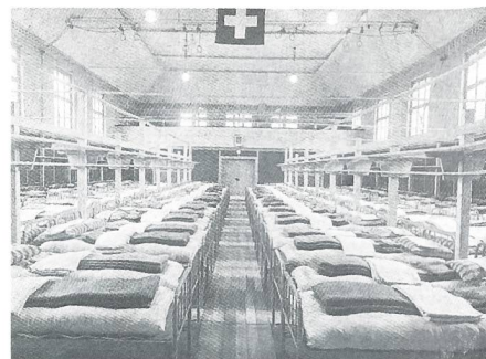
1940 bis 1946 wurde die Herrengass-Turnhalle von der Truppe als Kantonement benutzt.

Das vereinigte Kommando der Materialtruppen-Kaderschulen (OS/TSK) wird in der Kaserne einquar-