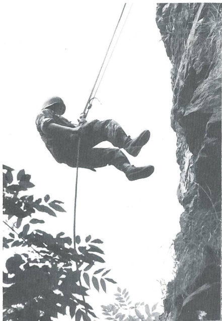
Mutprobe an der senkrechten Felswand.