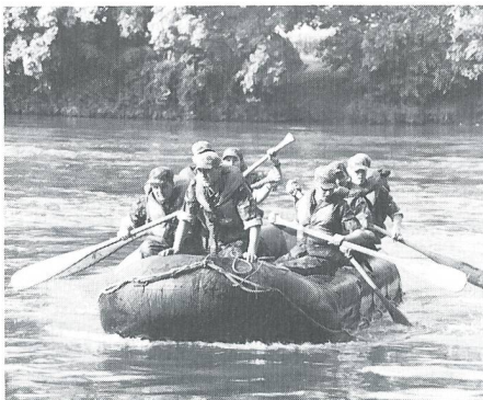
Paddelnd Richtung Beförderung zum Korporal der Genietruppen.